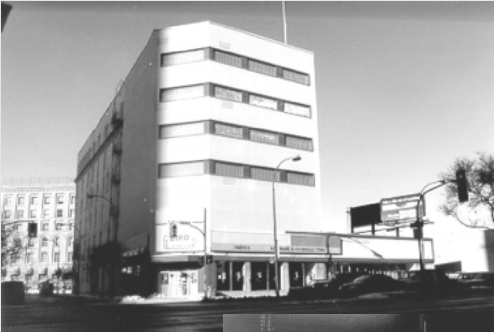
L'immeuble Big 4 aujourd'hui.