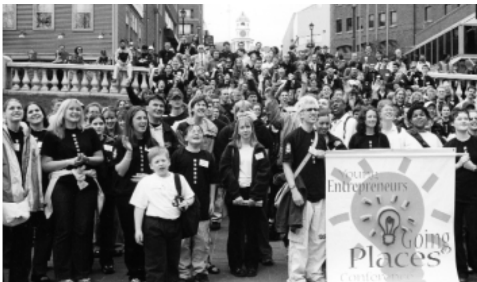
L'Esprit d'entrepreneurship 2000, à Halifax, a attiré plusieurs centaines d'élèves du Canada atlantique