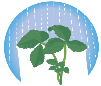
Figure 3 : Effet «parapluie»: il s'agit de protéger par un fongicide les jeunes feuilles jusqu'à ce qu'elles ne soient plus sensibles à la maladie, soit environ 15 jours. Ces feuilles protégeront à leur tour les nouvelles feuilles sensibles

Si les résultats fournis par le dépistage indiquent que la maladie nécessite d'être réprimée, on doit le faire en prévention. En effet, le seuil de tolérance de la tache commune est plus élevé que celui de la moisissure grise qui s'attaque directement au fruit. Pourtant, les résultats des récentes études québécoises nous ont révélé qu'en raison du mode d'infection de M. fragariae , la