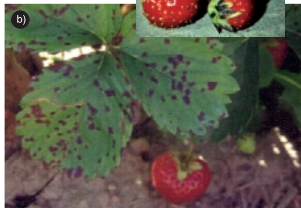
Figure 1 : Mycosphaerella fragariae , agent pathogène de la tache commune. a) sur sépales, b) sur feuilles