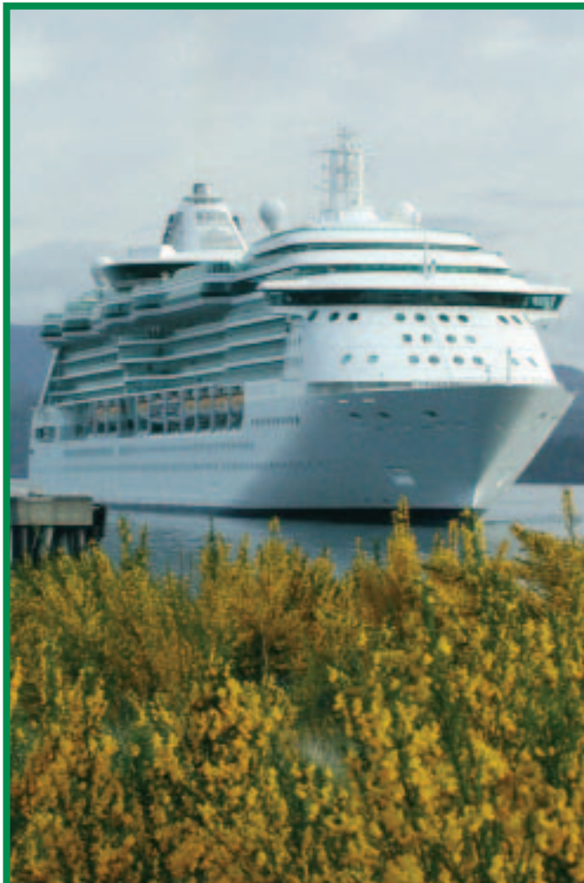
Des navires de croisière accosteront à Campbell River, en Colombie-Britannique.

Pour en savoir plus sur le Fonds de création de partenariats régionaux , consultez le site Web www.ainc-inac.gc.ca/ps/ecd/pas_f.html ou téléphonez sans frais au 1 800 567-9604 . Pour en savoir plus sur Diversification de l'économie de l'Ouest Canada , vous pouvez consulter son site Web à l'adresse www.wd.gc.ca . ■