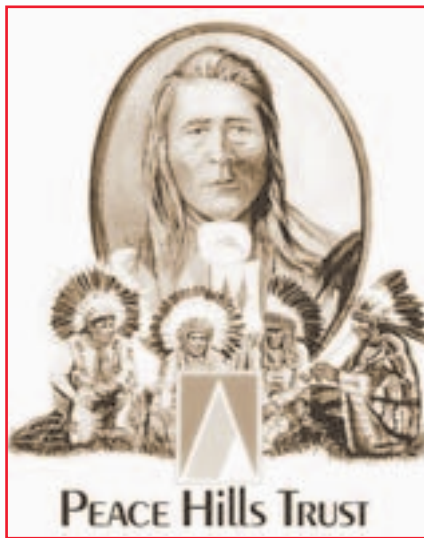
La société Peace Hills Trust travaille avec les Premières nations à stimuler le développement économique.

Quelque 5 000 membres de la nation crie de Samson vivent à Hobbema, en Alberta, ou dans les environs. Grâce aux ressources financières provenant de l'exploitation pétrolière et gazière menée sur ses terres, la Première nation cherche à protéger ses membres, à leur procurer de l'emploi et à leur offrir une formation. Au fil des années, les Cris de Samson se sont investis dans un certain nombre d'activités axées sur le développement durable. Parmi les projets réalisés, la Peace Hills Trust est sans nul doute un cas unique. De fait, cette entreprise a commencé modestement au début des années 80, moment où les Cris de Samson ont fondé leur propre institution financière. Dans quel but? Pour offrir des services financiers partout au Canada – des services pour les Premières nations et leurs membres, leurs sociétés, leurs institutions et leurs associations, tant à l'intérieur qu'à l'extérieur des réserves.