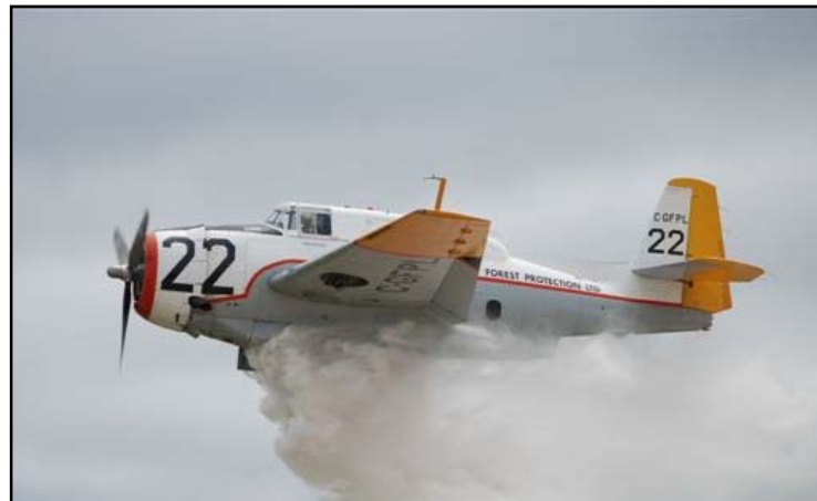
Photo 1. Bombardier d'eau TBM

conformément à la réglementation en vigueur et aux procédures approuvées, et qu'il ne présentait aucune défaillance connue avant le vol en question. L'avion était doté d'une radiobalise de repérage d'urgence (ELT) de 406 MHz. Il n'était pas équipé d'enregistreurs de bord, la réglementation ne l'exigeant pas. La masse et le centrage de l'appareil étaient à l'intérieure des limites prescrites au moment de l'accident.