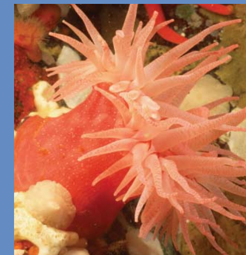
Aperçu du Programme des océans, Région du Pacifique Fs23-565/2010F-PDF 978-1-100-96025-8