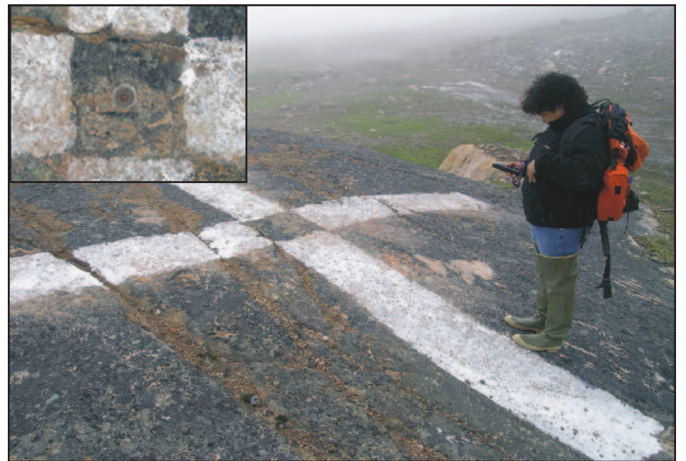
Figure 2 : Plusieurs sources de points d'appui ont servi à rectifier l'image, y compris des points GPS de haute précision et des points du réseau géodésique représentés par des croix peintes au sol. Ces points serviront aussi à l'orthorectification d'images stéréoscopiques à haute résolution acquises récemment pour la production d'un modèle numérique d'altitude détaillé couvrant Iqaluit et ses environs.