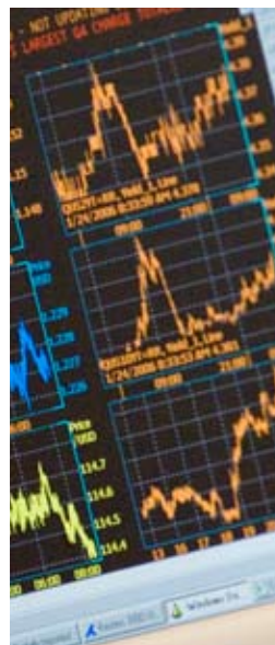
La salle des marchés de la Banque