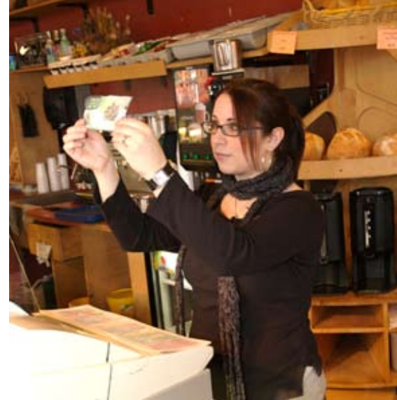
Une employée d'un commerce de détail vérifie l'authenticité d'un billet.

La Banque aide à former les caissiers à la détection des billets contrefaits.