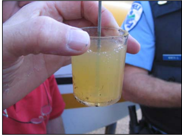
Photo 1. Eau provenant du filtre à carburant

Après avoir effectué les purges, le moteur a été démarré et maintenu en opération normale pendant quelques minutes avant d'être arrêté. L'essai moteur n'a révélé aucune anomalie. Par suite de l'essai moteur, l'avion a été déplacé sur le trottoir pour rétablir la circulation automobile. Le réservoir droit a été purgé de nouveau et près de 2 onces d'eau jaunâtre ont été recueillies.