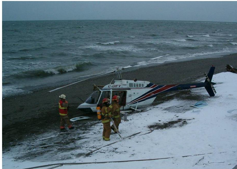
Photo 1. Vue de l'épave

trouve à quelque 120 pieds au-dessus du fleuve et 75 pieds de la rive à une vitesse de 70 nœuds, il y a une détonation suivie d'un lacet momentané vers la droite. Dans les instants suivants, une deuxième détonation se produit. Le pilote abaisse aussitôt le pas collectif et vire à droite pour effectuer un atterrissage sur la plage face au vent. Le klaxon bas régime rotor retentit lors de la descente. L'aéronef atterrit brutalement sur le sable et le train d'atterrissage se rompt (photo 1).