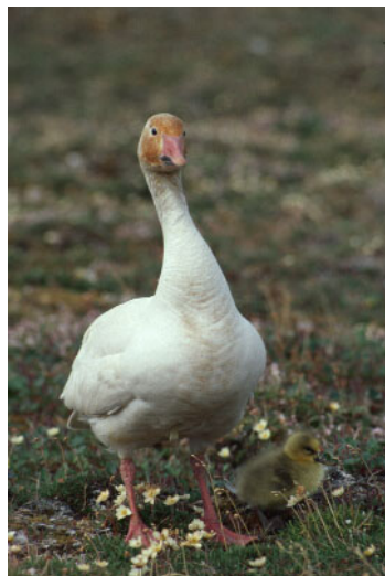
Espèce : Chen caerulescens Oie des neiges

La présente enquête vise à caractériser les souches de virus de l'influenza aviaire chez la sauvagine du Canada et à assurer la détection précoce, chez celle-ci, de souches hautement pathogènes de cette maladie. Cette enquête, qui se veut un élargissement de l'enquête nationale de 2005 sur les souches de virus de l'influenza aviaire chez les canards sauvages, met davantage l'accent sur les oiseaux qui migrent périodiquement entre la région de l'Atlantique Nord du Canada et l'Europe, ou qui passent une partie de l'année à proximité d'espèces qui hivernent en Europe. Cette enquête élargie complète les travaux effectués aux États-Unis, qui portent sur les populations de l'Ouest (voie migratoire du Pacifique).