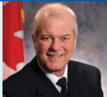
Keith Ashfield Ministre Pêches et Océans

« La Garde côtière canadienne est une source de fierté nationale et elle est fidèle à sa devise : Sécurité d’abord, service constant ».