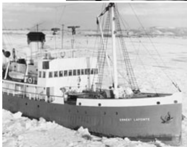
Ernest Lapointe, en service de 1940 à 1978 – Brise glace