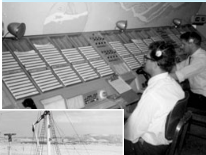
Services de communications et de trafic maritimes, 1965

Après des années de recherche, le rapport final de la Commission royale d'enquête sur l'organisation du gouvernement, publié le premier de l'an 1962, recommandait la consolidation progressive de toutes les activités civiles de patrouille et d'application de la loi en une Garde côtière canadienne.