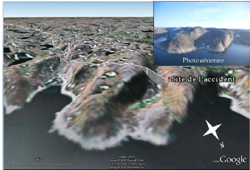
Figure 1. Trajectoire enregistrée par le système de positionnement mondial (GPS)

L'accident s'est produit à un peu moins de 1 nm du détroit d'Hudson, dans une vallée côtière située à 36 nm au sud-est de Kangiqsujuaq. La vallée orientée vers l'ouest est enclavée par deux escarpements rocheux et mesure environ 2300 pieds de largeur. Le sommet du flanc sud est à 1050 pieds asl; celui du flanc nord est à quelque 820 pieds asl. L'appareil se dirigeait en direction nord lorsqu'il a heurté le flanc nord de la vallée à environ 700 pieds asl.