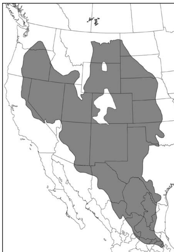
Figure 1. Aire de répartition mondiale du rat Kangourou d'Ord (d'après des cartes publiées par NatureServe (2008) et COSEPAC (2006)).

La répartition générale de l'espèce n'a pas subi de changements importants récents (COSEPAC, 2006).