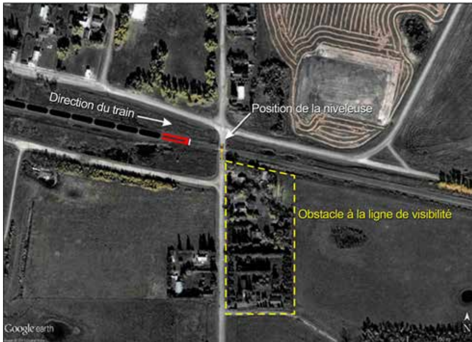
Photo 1. Emplacement de l'accident au passage à niveau

La plus récente inspection du passage à niveau par Transports Canada, telle que consignée dans le système intégré d'information ferroviaire de Transports Canada pour cet endroit, a eu lieu le 1 er mai 2002. À cette époque, le relevé de trafic journalier pour le passage était de 250 véhicules automobiles et de 3 trains, d'où un produit vectoriel de 750. Un relevé de trafic en 2009 par le ministère de la Voirie et de l'Infrastructure de la Saskatchewan avait indiqué un trafic journalier moyen au passage à niveau de 380 véhicules automobiles et de 4 trains, pour un produit vectoriel de 1520. Le prochain relevé par les autorités provinciales est prévu pour 2014.