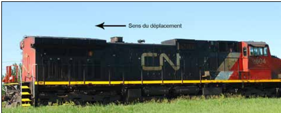
Photo 2 Localisation et orientation du klaxon sur la locomotive

Selon le paragraphe 11.2 du Règlement relatif à l'inspection et à la sécurité des locomotives de chemin de fer , les locomotives doivent être équipées d'un « avertisseur capable de produire un niveau sonore minimal de 96 dB(A) en tout point d'un arc de 30 mètres (100 pieds) de rayon sous-tendu devant la locomotive par des angles de 45 degrés à gauche et à droite de l'axe de la voie dans le sens du déplacement ».