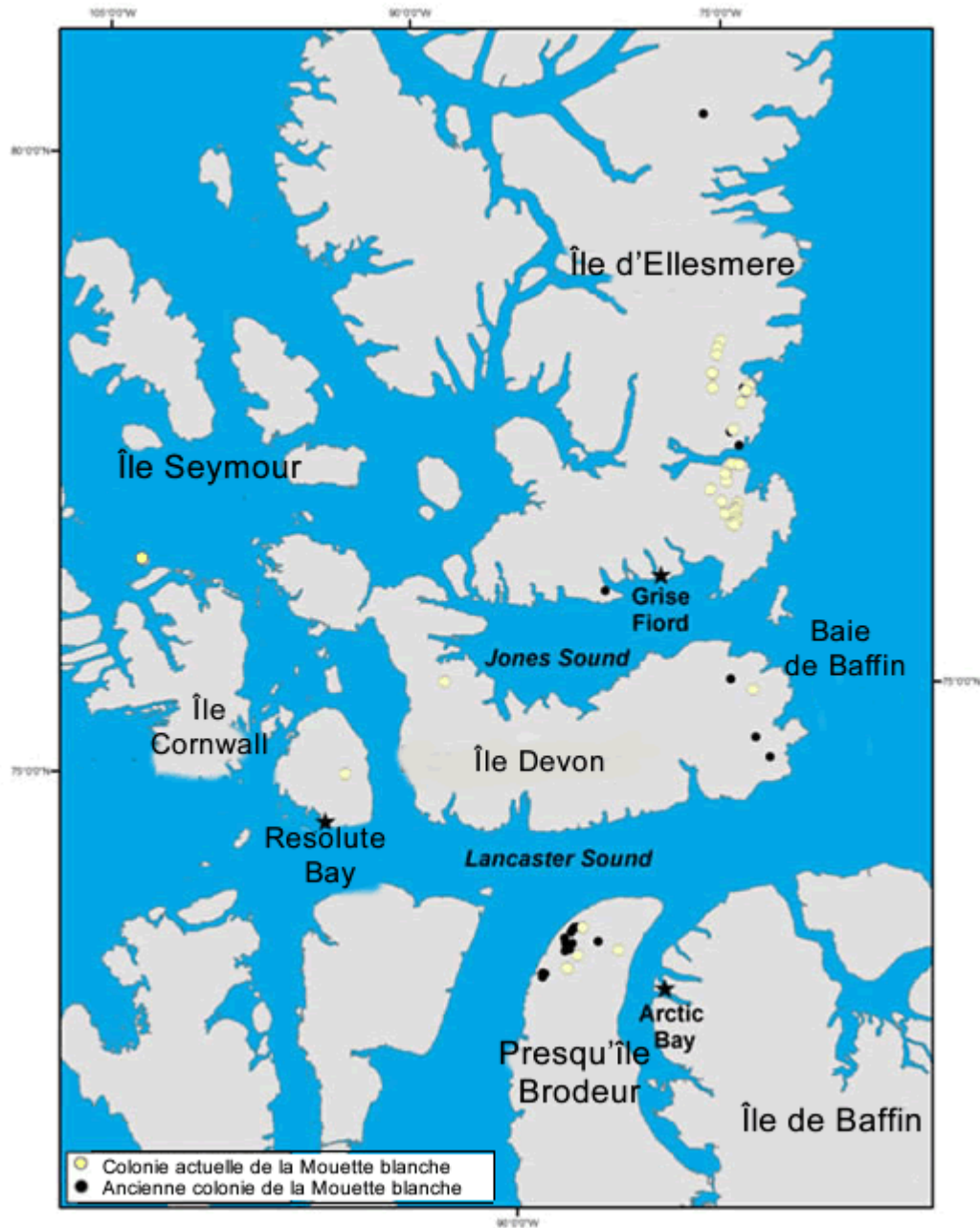
Figure 3 : Emplacements connus des colonies de nidification de l'espèce au Canada. Les sites existants sont ceux qui, depuis 2002, ont été occupés au moins une fois, tandis que les anciens sites de nidification sont ceux pour lesquels la dernière occupation connue par les Mouettes blanches a eu lieu avant 2002.

Au Canada, on sait que la Mouette blanche n'a de sites de nidification qu'en cinq endroits du Nunavut : l'île d'Ellesmere, l'île Devon, l'île Cornwallis, l'île Seymour et la presqu'île Brodeur dans le nord de l'île de Baffin (figure 3). En 2009, presque tous les sites existants se trouvaient dans la partie centre-est de l'île d'Ellesmere (M. Mallory, données inédites). Chaque année entre 2002 et 2006, puis de nouveau en 2009, des relevés de tous les sites de reproduction connus ont été réalisés par hélicoptère (Gilchrist et Mallory, 2005; Robertson et coll., 2007; Mallory, données inédites). Bien que de nouveaux sites de reproduction aient été découverts après 2002