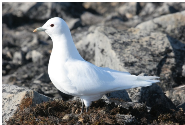
Figure 1 – Mouette blanche adulte

La Mouette blanche est un laridé de taille moyenne dont le poids (environ 600 g) et l'envergure (environ 94 cm) sont supérieurs d'environ 10 % à ceux de la Mouette tridactyle ( Rissa tridactyla ), plus commune. On peut facilement reconnaître la Mouette blanche quel que soit son âge, mais à l'âge adulte, son plumage est d'un blanc pur particulièrement saisissant; ses pattes sont noires et son bec est vert olive (figure 1). Le plumage des juvéniles est blanc moucheté de noir. Les nids, une dépression du sol ou une coupe de mousse, comptent entre un et trois œufs; les nids peuvent se trouver sur des îles isolées, des plateaux de galets calcaires sans relief notable ou des falaises abruptes de « nunataks » (sommets de montagnes qui émergent des glaciers ou de la calotte glaciaire – pour ainsi dire une île située à l'intérieur des terres et entourée de glace de glaciers) (Haney et MacDonald; 1995). Le mâle et la femelle couvent le nid pendant 24 à 26 jours; les œufs éclosent habituellement à la fin de juillet et les jeunes prennent leur envol entre 30 et 35 jours après l'éclosion. On peut trouver des descriptions plus détaillées de l'espèce dans les ouvrages de Haney et MacDonald (1995) et du COSEPAC (2006).