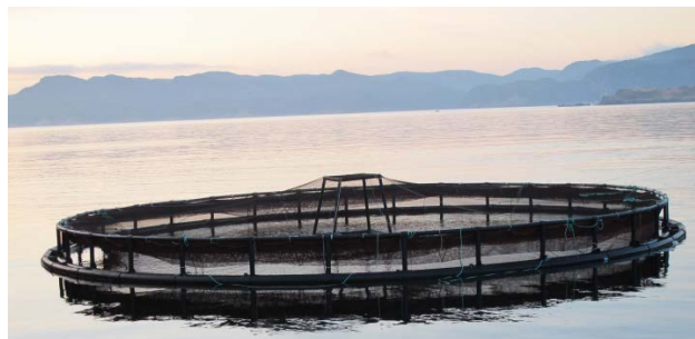
Cage aquacole sur la côte Sud de Terre-Neuve-et-Labrador (T.N.L.).