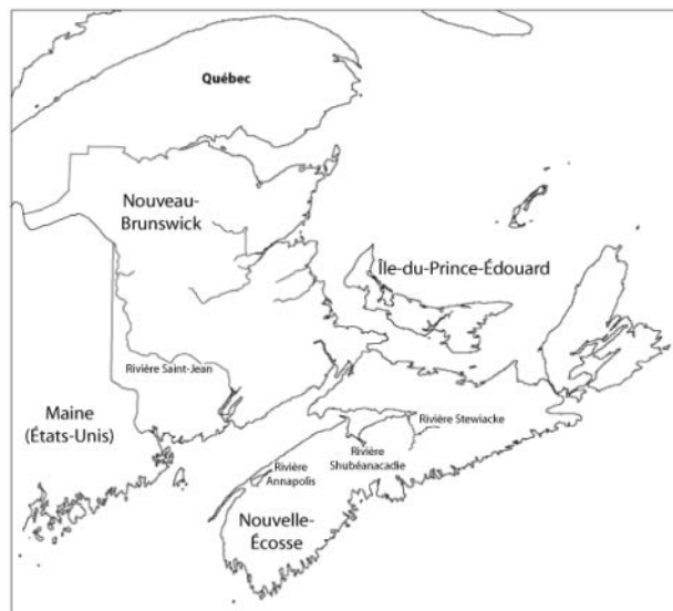
Figure 1. Carte indiquant l'emplacement de l'unité désignable du bar rayé de la baie de Fundy et les rivières de frai qu'elle englobe.