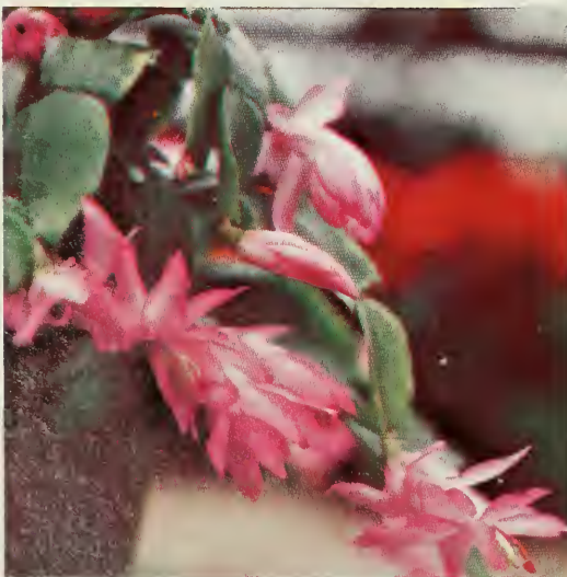
cactus de Noël

Pour forcer les bulbes, il faut les placer dans un endroit frais (de 5°C à 9°C) pendant 12 semaines. Les racines et les parties internes du bulbe se développeront durant cette période. Il est même possible, à l'occasion, d'acheter des bulbes "prérefroidis". Pour obtenir de meilleurs résultats, planter les gros bulbes dans un pot deux fois plus long que les bulbes. Étiqueter le contenant et arroser régulièrement pendant 12 semaines. Si les racines sont bien formées après cette période de fraîcheur (vérifier en retirant la plante du pot), placer le pot dans une pièce peu éclairée à 15°C pendant environ 1 semaine, puis en plein soleil à une température ne dépassant pas 18°C.