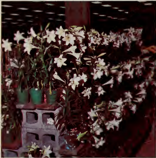
lis de Pâques