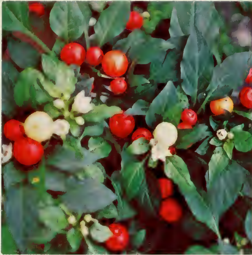
cerisier de Jérusalem