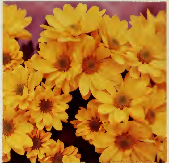
chrysanthème en pot