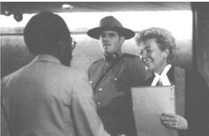
Obtention de la citoyenneté

Il s'agit d'un examen écrit. Au moment de l'examen, efforcez-vous de garder votre calme. Cela vous aidera à comprendre les questions posées et à réfléchir à vos réponses.