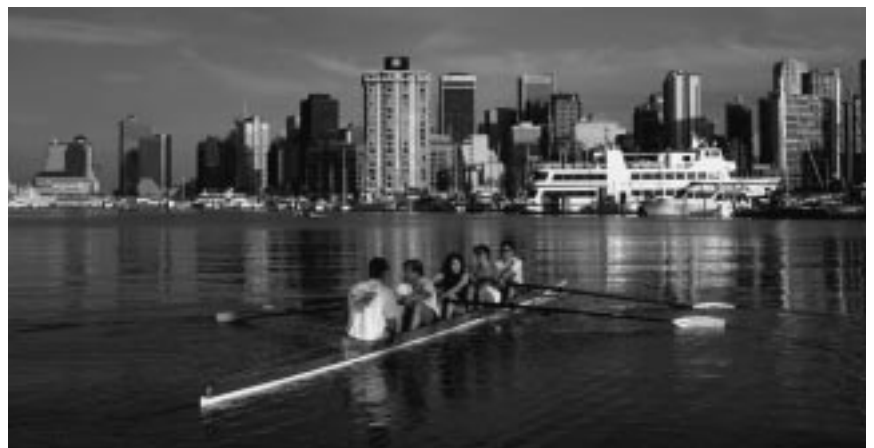
Troisième grande ville canadienne, Vancouver est un important centre d'expédition et relie par voie aérienne le Canada et les pays de l'autre littoral du Pacifique, comme la Chine et le Japon.