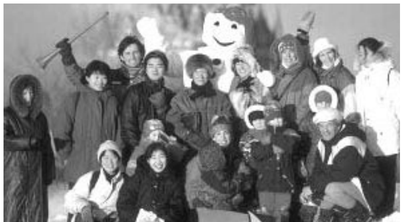
Le bonhomme Carnaval, aux festivités d'hiver de Québec, avec le château Frontenac à l'arrière-plan

Au début du XVI e siècle, Jacques Cartier a employé le mot « kanata », utilisé par les Premières Nations pour dire « village », afin de désigner tout le pays. Par la suite, les cartographes européens ont donné le nom de « Canada » à tout le territoire situé au nord du fleuve Saint-Laurent.