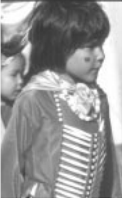
Jeune Amérindien en costume traditionnel au stampede de Calgary

Le Manitoba, la Saskatchewan et l'Alberta sont appelées les provinces des Prairies. Cette région du Canada est bien connue pour la fertilité de ses terres agricoles et la richesse de ses ressources énergétiques.