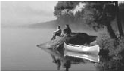
Parc provincial Algonquin

Les peuples algonquins et iroquois ont été les premiers à habiter la province qu'on appelle aujourd'hui l'Ontario. Vers la fin du XVIII e siècle, la population a commencé à croître rapidement. L'arrivée de milliers de loyalistes a été suivie de plusieurs vagues d'immigrants venus des États-Unis et de l'Angleterre. Aujourd'hui, l'Ontario continue d'accueillir de nouveaux arrivants venus de tous les coins du monde.