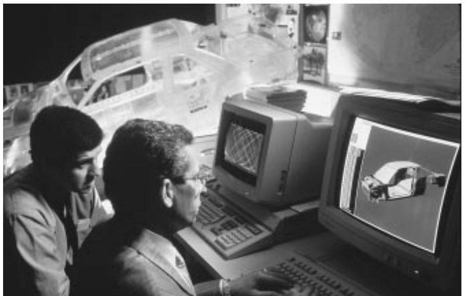
La fabrication des automobiles

Le Canada est formé de dix provinces et de deux territoires. Chaque province et chaque territoire ont leur propre capitale. Vous devriez savoir quelle est la capitale du Canada et celle de votre province ou de votre territoire (voir à la page 12).