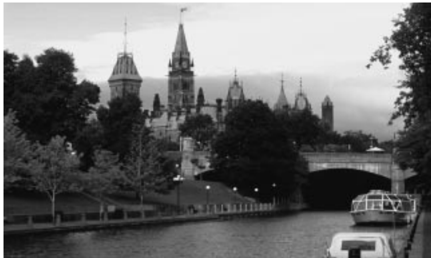
Vue du parlement depuis le canal Rideau, Ottawa, Ontario

Le Premier ministre est le chef du parti politique qui a le plus grand nombre de députés élus à la Chambre des communes.