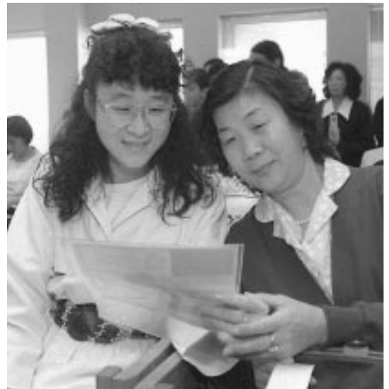
Néo-Canadienne regardant avec fierté ses nouveaux papiers d'identité canadiens, à Lethbridge (Alberta)

Certains droits relatifs à la citoyenneté sont définis dans les lois canadiennes : par exemple, le droit de voir sa candidature évaluée en premier (avoir la préférence) pour obtenir un poste au gouvernement fédéral.