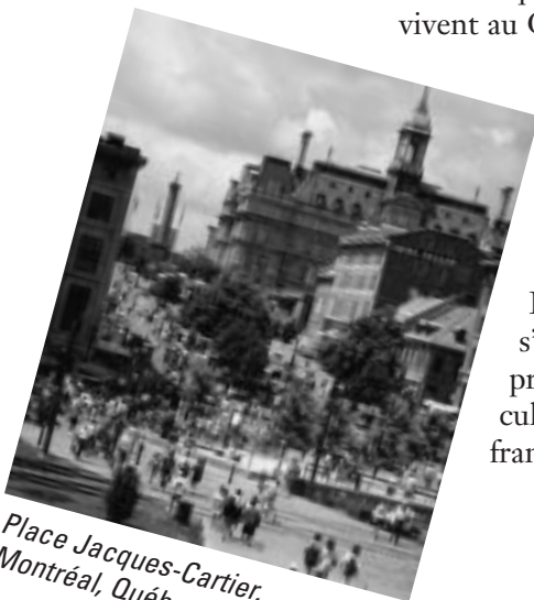
Place Jacques-Cartier, Montréal, Québec

Depuis la Confédération, la région de Montréal a toujours occupé une place prépondérante dans les secteurs de l'industrie, des finances et des services. Les industries de cette région produisent de l'étoffe, des vêtements, des aliments, du papier, du métal, des produits chimiques et des produits du bois. Montréal est aussi le centre d'un vaste réseau de transport; c'est pourquoi de nombreuses entreprises de transport sont installées dans cette région. Par ailleurs, plus de la moitié de l'industrie aéronautique et aérospatiale canadienne y est établie.