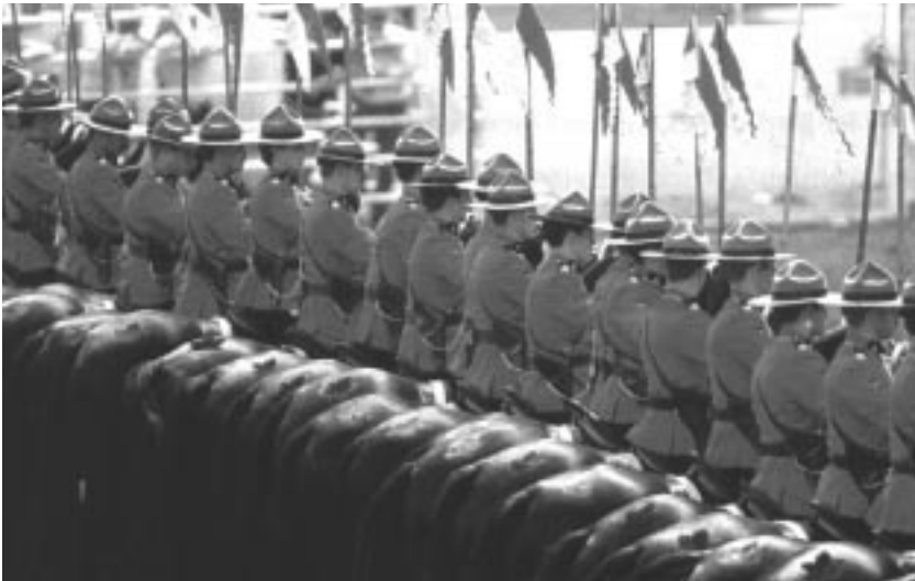
La gendarmerie royale du Canada

Chaque année, le 1 er juillet, nous célébrons la Fête du Canada, jour anniversaire de la Confédération.