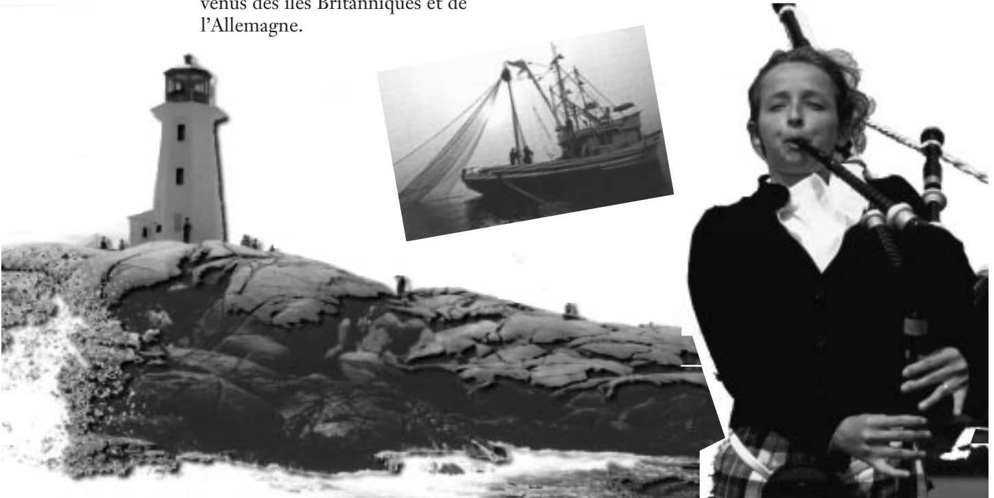
Peggy's Cove, Nouvelle-Écosse

Aujourd'hui, la population de la région de l'Atlantique est très diversifiée sur les plans culturel et ethnique. Une grande partie des habitants de cette région sont des descendants des premiers colons. Le Nouveau-Brunswick est la seule province du Canada qui est officiellement bilingue : environ le tiers de la population y est francophone.