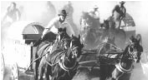
Stampede au Manitoba

Les industries manufacturières du Manitoba fabriquent une multitude de produits, y compris des aliments, de la machinerie, du matériel de transport, des produits de métal et des vêtements. En Saskatchewan, les principales industries sont celles de l'alimentation et des produits chimiques.