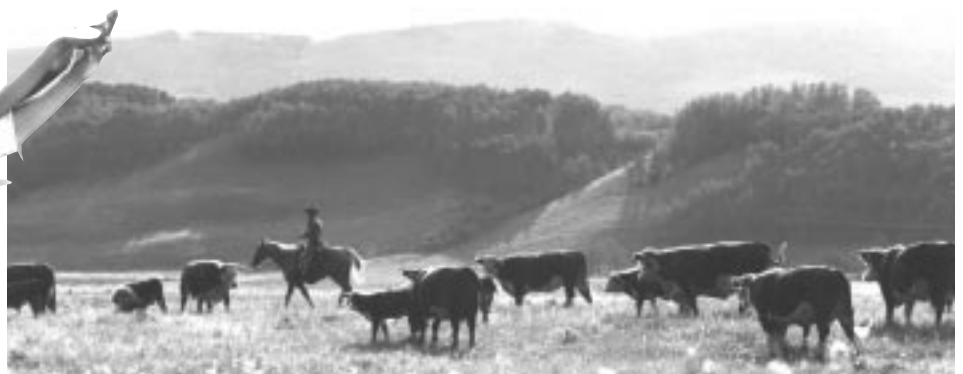
Élevage bovin en Alberta

Les Prairies possèdent de vastes ressources énergétiques. Environ la moitié de toute l'énergie consommée au Canada provient du pétrole et du gaz naturel. Premier producteur canadien de ces combustibles, l'Alberta compte aussi une importante industrie minière de charbon. La Saskatchewan est un grand producteur de pétrole, de gaz naturel, d'uranium et de potasse. Le Manitoba, territoire aux cent mille lacs, est le plus grand producteur d'hydro-électricité des Prairies.