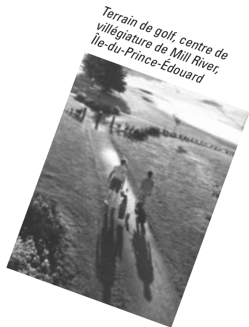
Terrain de golf, centre de villégiature de Mill River, Île-du-Prince-Édouard