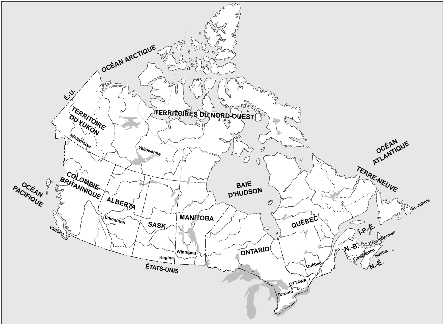
Cette carte est établie d'après les renseignements tirés de la carte numérique de l'Atlas national du Canada à l'échelle 1/30 million. © 1997 Sa Majesté la Reine du chef du Canada, avec l'autorisation de Ressources naturelles Canada.