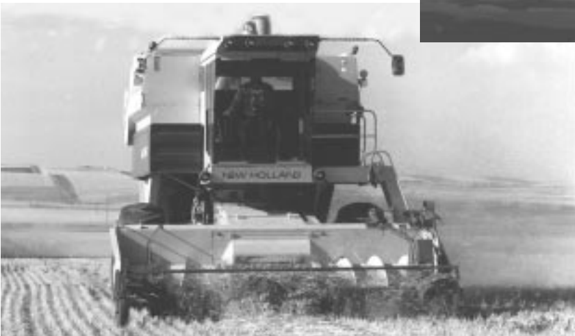
La vie dans les Prairies