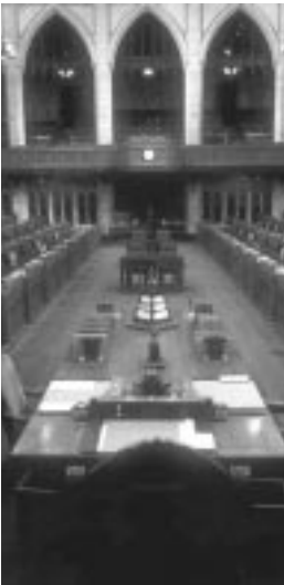
La Chambre des communes

Les membres d'un parti politique se réunissent pour discuter de leurs idées et de leurs opinions. Ils formulent un plan, qu'on appelle le programme du parti, pour décrire les mesures que le parti prendrait s'il était porté au pouvoir lors d'une élection.