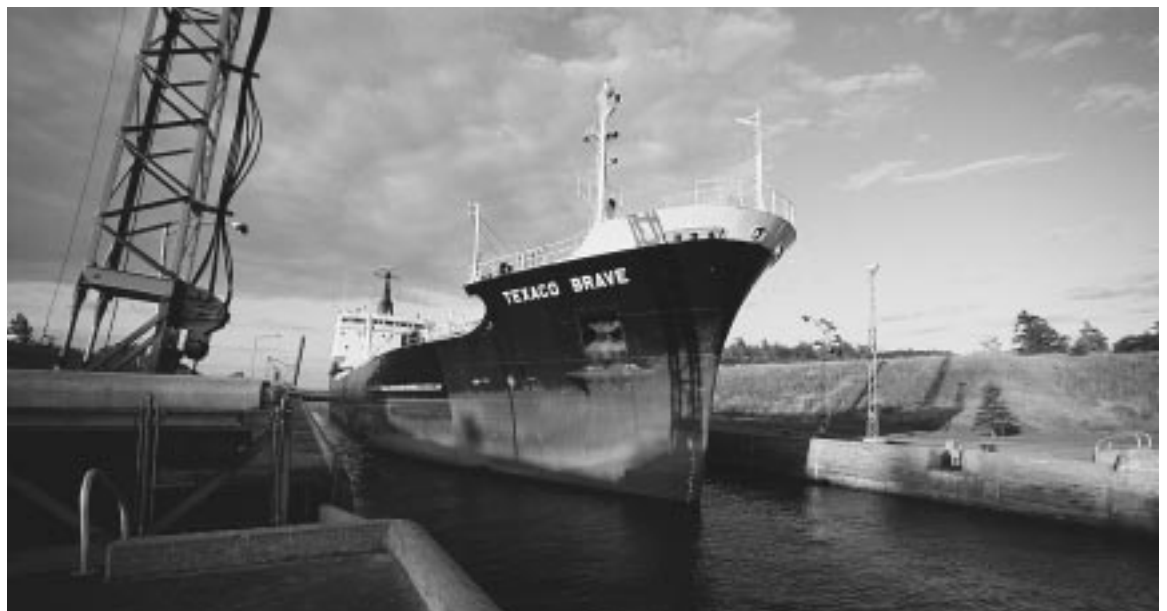
La Voie maritime du Saint-Laurent

Le Bouclier canadien est couvert de forêts, et la grande industrie canadienne des pâtes et papiers dépend des forêts de cette région. Une partie des vastes réserves d'eau douce du Bouclier canadien est utilisée pour produire de l'électricité.