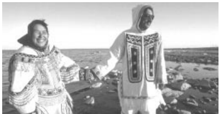
Les Territoires du Nord-Ouest

La population des Territoires du Nord-Ouest a décidé par un vote de faire de la région de l'est un territoire distinct appelé Nunavut. Le nouveau territoire vena le jour le 1 er avril 1999.