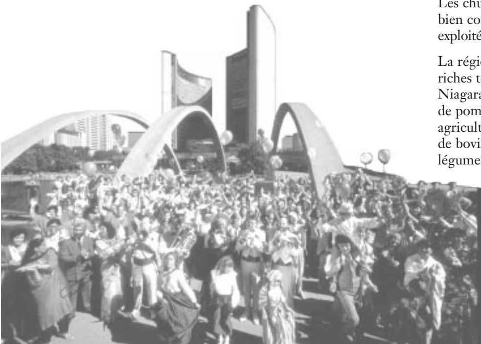
Hôtel de ville de Toronto