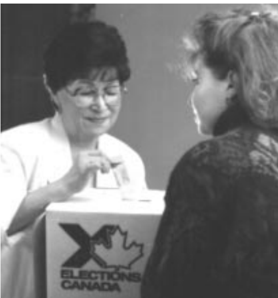
Il importe que vous votiez!

Les partis qui ne sont pas au pouvoir sont appelés les partis d'opposition. Le parti d'opposition qui a le plus grand nombre de députés à la Chambre des communes forme l'Opposition officielle. Les partis d'opposition tentent d'améliorer ou de faire rejeter les lois proposées par le gouvernement.