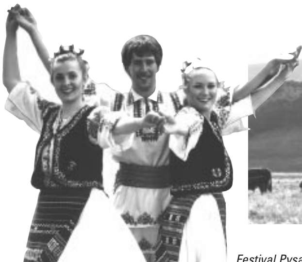
Festival Pysanka, Alberta