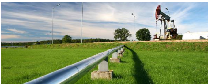
Source : Indices des prix des produits industriels et des matières brutes, mars 2018

Les prix des produits vendus par les fabricants canadiens, tels que mesurés par l'Indice des prix des produits industriels, ont augmenté de 0,8 % en mars, entraînés à la hausse surtout par les prix des produits énergétiques et du pétrole et des produits de pâtes et papier. Les prix des matières brutes achetées par les fabricants canadiens, tels que mesurés par l'Indice des prix des matières brutes, ont progressé de 2,1 %, principalement en raison de la hausse des prix des produits énergétiques bruts.