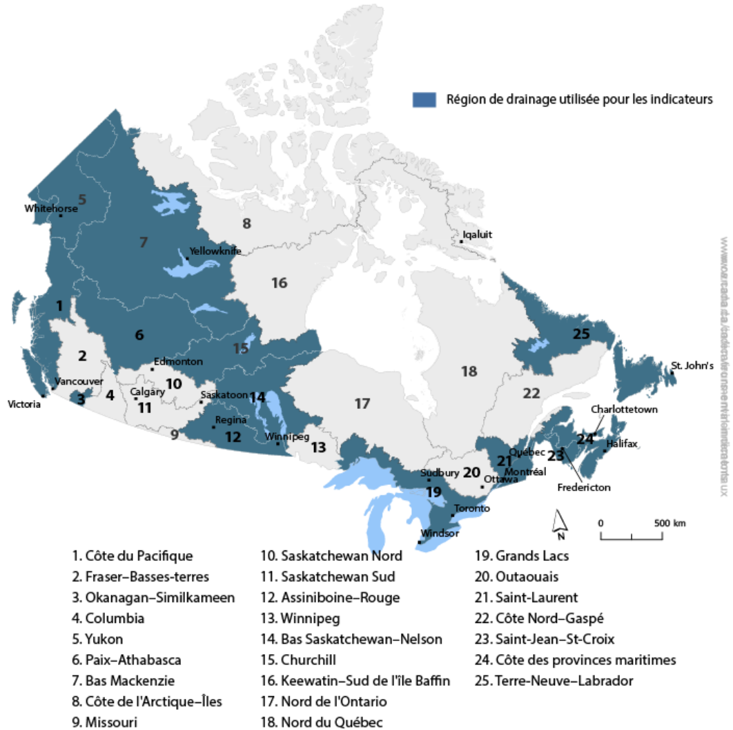
Figure 2. Portée géographique des régions de drainage utilisées pour les indicateurs