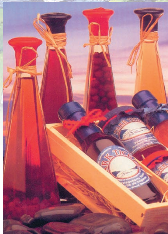
Dark Tickle Company est situé à Griquet, dans la péninsule nord de Terre-Neuve-et-Labrador. On y fait des confitures, sauces, vinaigres, thés, boissons et chocolats à partir de petits fruits sauvages.

À l'heure actuelle, dix entreprises membres du réseau ÉCONOMUSÉE se trouvent dans la région de l'Atlantique, dont neuf situées en région rurale. Diverses spécialités sont représentées par ces commerces, comme le savon, les bijoux en étain, le chocolat et le vin. Dès qu'une de ces entreprises est admise au réseau, l'artisan fait l'objet d'une description dans des brochures et du matériel de promotion touristique distribués dans la région de l'Atlantique, au Québec et en Ontario, ainsi que dans les agences de tourisme, les salons de voyagistes, etc. En plus de ces activités de marketing direct, les membres du réseau peuvent suivre des cours sur divers sujets liés à la gestion d'une entreprise, y compris la promotion et le merchandising. Dans ses plans d'avenir, le réseau prévoit la mise sur pied d'une boutique en ligne où seront offerts les produits des artisans et l'accroissement du nombre de membres, en particulier dans les secteurs du travail du bois, du verre et de la céramique.