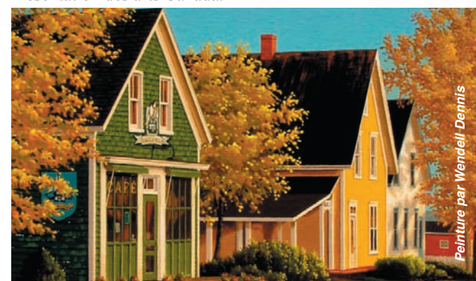
Peinture par Wendell Dennis

Le théâtre Victoria Playhouse est financé par Héritage Canada dans le cadre du programme Présentation des arts Canada.