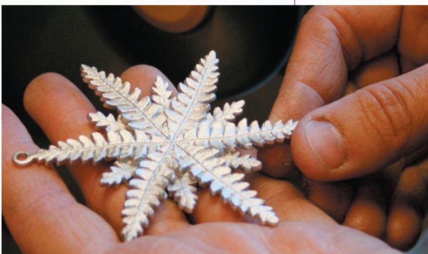
Dans la pittoresque petite ville de Mahone Bay, Amos Pewter dessine et fabrique, depuis 1974, des cadeaux exquis. Les designs sont distinctement néo-écossais et inspirés par la nature et les superbes paysages côtiers environnants.

Afin de les aider, un nouvel organisme cherche à susciter de nouvelles expériences touristiques, en mettant l'accent sur la promotion du travail d'artisans. Le réseau ÉCONOMUSÉE® de l'Atlantique met actuellement en place un réseau touristique dans la région de l'Atlantique afin de mettre en valeur des artisans et des métiers.