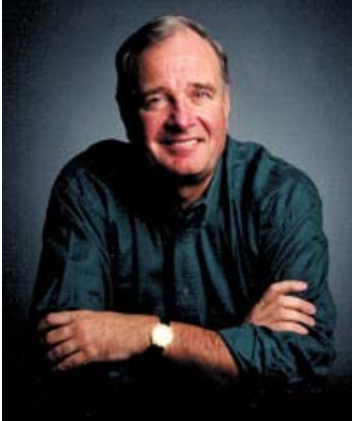
L'honorable Paul Martin, C.P., député.

En tant que principale source de conseils et d'analyses en matière économique et financière au Canada, le ministère des Finances joue un rôle crucial dans les efforts déployés par le gouvernement fédéral pour assurer à tous les Canadiens un niveau de vie élevé et une meilleure qualité de vie.