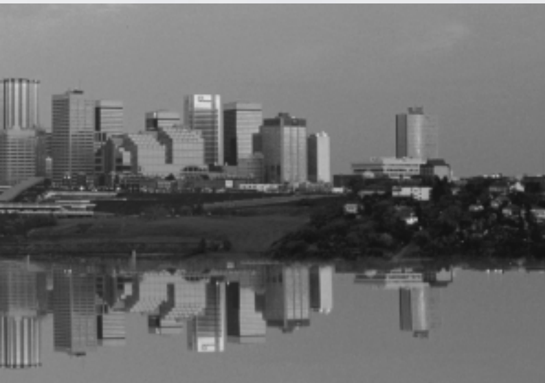
Les villes où il est intéressant de faire des affaires, parmi tous les pays du G-7.