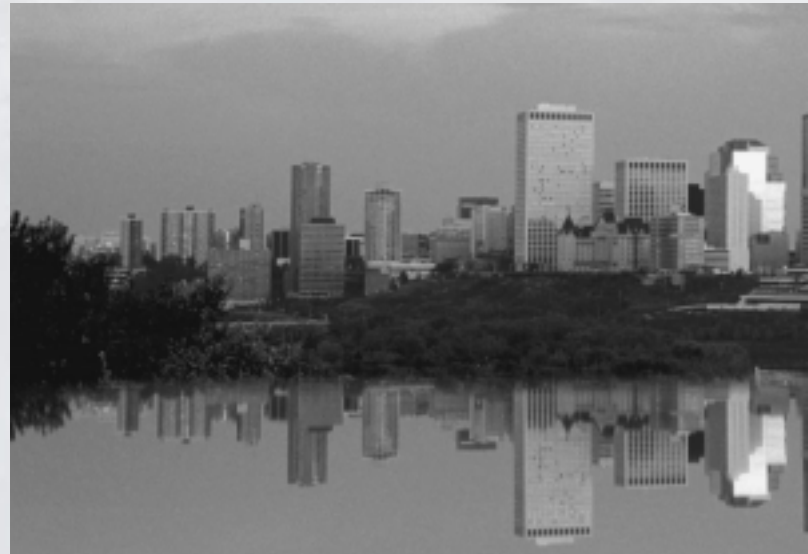
Un récent rapport de KPMG Consulting mettait Edmonton au premier rang de

La Competitiveness Strategy a adopté une approche fondée sur des grappes d'industries. Chacune des grappes comprend trois niveaux : des entreprises offrant des produits ou des services semblables ou connexes, des fournisseurs conjoints et des bases économiques qui les appuient (p. ex. : des établissements d'enseignement, des infrastructures physiques, des ressources humaines, un climat commercial et la qualité de la vie). Les équipes des grappes se réunissent régulièrement pour élaborer une vision commune et lancer de nouvelles initiatives, et elles peuvent devenir des stimulants économiques pour la collectivité. La Competitiveness Strategy a cerné huit grappes : la fabrication de pointe; les produits agroalimentaires et forestiers; la biomédecine