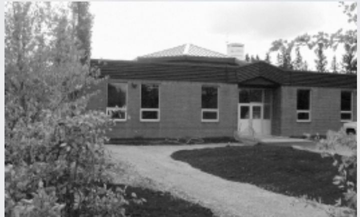
Un des points culminants de l'existence de l'OCCI depuis sa création est probablement l'inauguration officielle du Dr. Robert Turner Research Centre, d'une valeur de 1,2 million de dollars, qui a eu lieu en novembre 2001.

Le succès du Olds College Centre for Innovation est attribuable à l'appui sans faille du gouvernement de l'Alberta, ainsi que du collège, de la collectivité, de l'industrie et des autres intervenants du gouvernement. Toutefois, l'OCCI reconnaît également le rôle