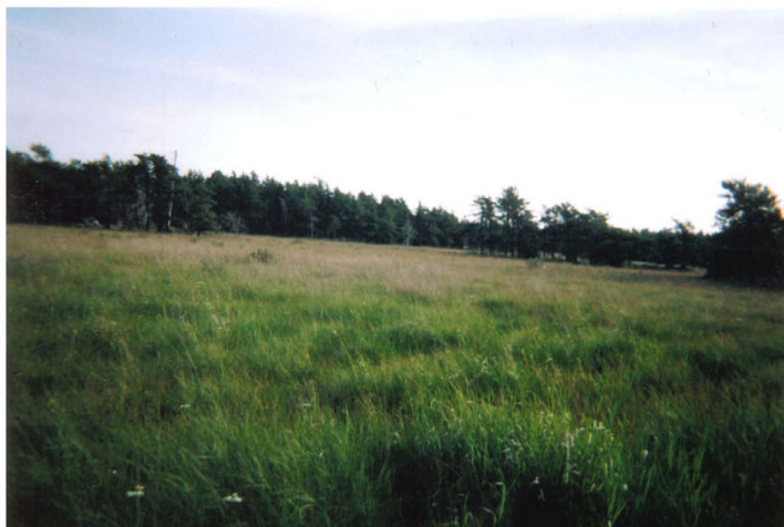
Figure 4. Habitat de la verge d'or de Houghton ( Solidago houghtonii ) au cap Cabot.