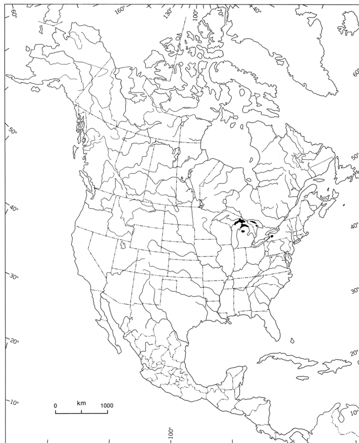
Figure 2. Répartition mondiale de la verge d'or de Houghton ( Solidago houghtonii ). Aires d'occurrence établies selon diverses publications (p. ex. Morton [1979], Penskar [1997], Voss [1996])

La verge d'or de Houghton est une espèce endémique des Grands Lacs dont la majeure partie de la population mondiale se trouve sur les rives nord des lacs Michigan et Huron (figure 2). Elle est particulièrement abondante au Michigan, où on trouve des populations continues ou semi-continues le long du littoral des Grands Lacs (U.S. Fish and Wildlife Service, 1988). Une population isolée est présente à l'intérieur des terres dans les comtés de Crawford et de Kalkaska, au Michigan, et une autre, au marécage de Bergen, dans le comté de Genesee, dans l'ouest de l'État de New York (Michigan Natural Features Inventory, 1996). Selon un document sur le genre Solidago que Semple et Cook préparent actuellement dans le cadre du Flora of North America Project, l'identification des individus trouvés dans l'État de New York serait erronée; l'espèce est absente de cet état.