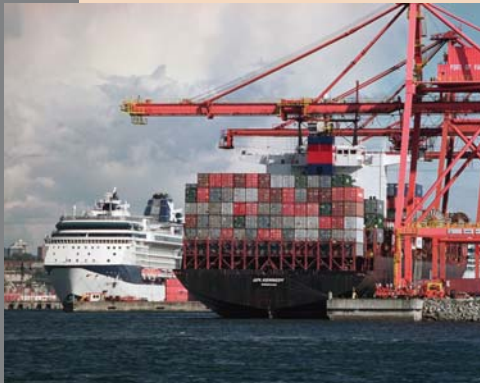
Le port de Vancouver a enregistré un trafic de plus de 73 millions de tonnes en 2004.

La stratégie affectera jusqu'à 590 millions de dollars à des mesures et des projets bien précis touchant le développement de l'infrastructure de transport, la mise en place de services frontaliers plus sûrs et plus efficaces ainsi que le renforcement des liens avec l'Asie-Pacifique.