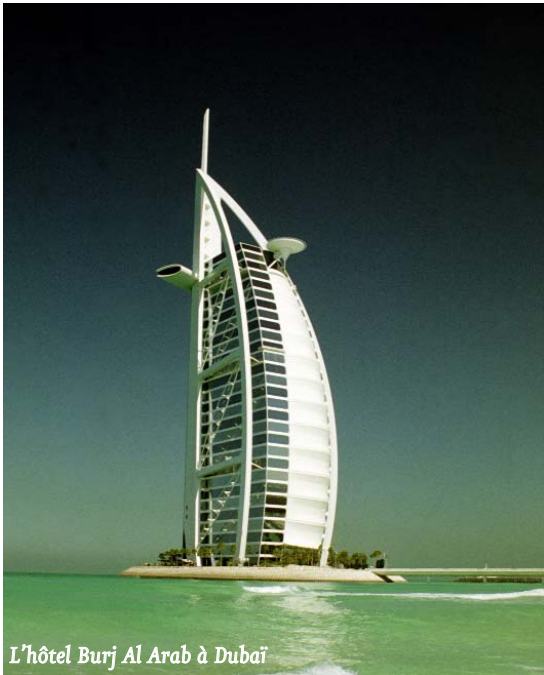
L'hôtel Burj Al Arab à Dubaï