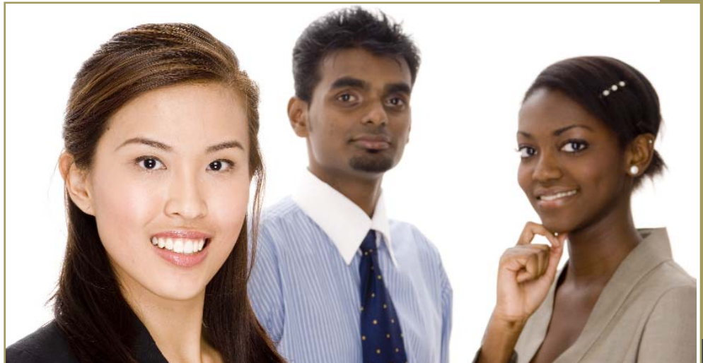
De plus en plus de débouchés pour les « fournisseurs de la diversité » aux États-Unis.

Dans le cadre de cette promotion de deux jours, les participants américains ont pu visiter différents magasins d'alimentation de la région de Toronto et voir sur les rayons de ces commerces bon nombre des produits qui leur ont été présentés le lendemain par les entreprises participantes.