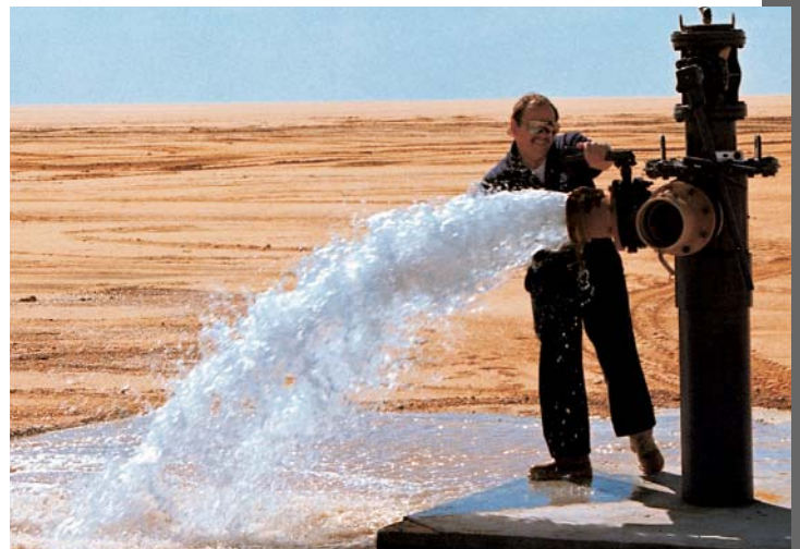
Ce n'est pas un mirage : le puits de 700 mètres de profondeur de SNC-Lavalin dans le désert du Sahara pompe la nappe phréatique de Libye. Les débouchés abondent pour d'autres entreprises canadiennes.

En 2000, après avoir remporté ses premiers succès sur le marché américain, Pressure Pipe Inspection Company, située en Ontario, a