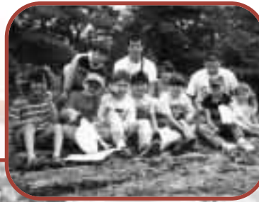
Des jeunes de la Première nation de Moose Deer Point.

Niigon Technologies comblera ses besoins énergétiques au moyen de piles à combustible et de panneaux solaires.