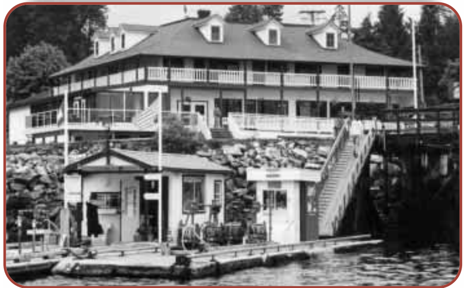
L'hôtel Lund, vu à bord d'un bateau.