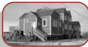
La construction de nouvelles habitations à Arviat.

Le Conseil canadien des sociétés publiques-privées a également reconnu le succès du projet. En novembre 1999, la NCC et le MAINC ont remporté le prix du mérite de l'infrastructure dans la catégorie « Partenariats innovateurs en matière de développement » pour leur remarquable projet de construction. ✱