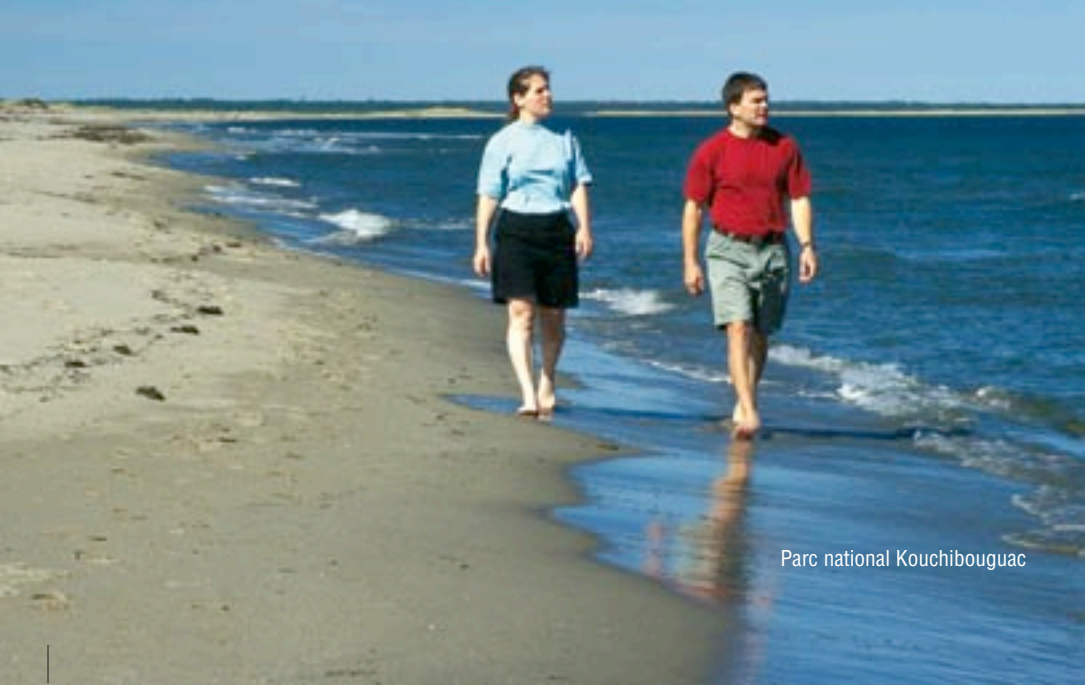
Parc national Kouchibouguac