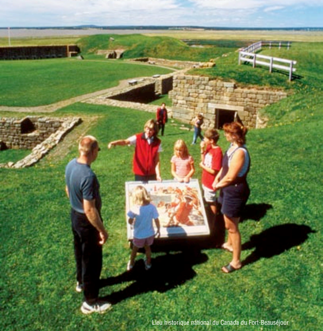
Lieu historique national du Canada du Fort-Beauséjour