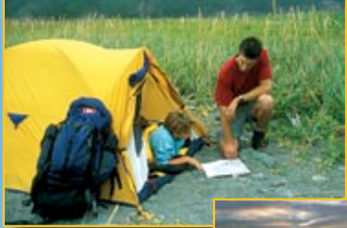
Parc national Fundy