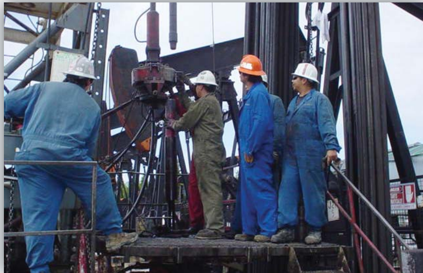
Des employés de la société Pimee Well Servicing à l'oeuvre sur un chantier de forage

La société Pimee Well Servicing Ltd. oeuvre dans le secteur de l'exploitation pétrolière depuis 21 ans. Lors de sa création en 1984, la société ne disposait que d'un seul appareil de forage, elle jouit présentement de sept appareils de forage et des équipements connexes.