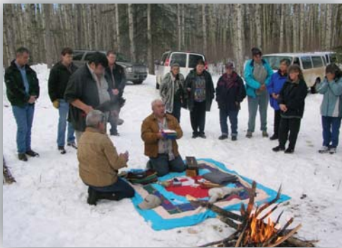
Cérémonie de bénédiction de la Terre lors du roulement du projet de récupération pétrolière de Jackfish de la société Devon Canada Corporation