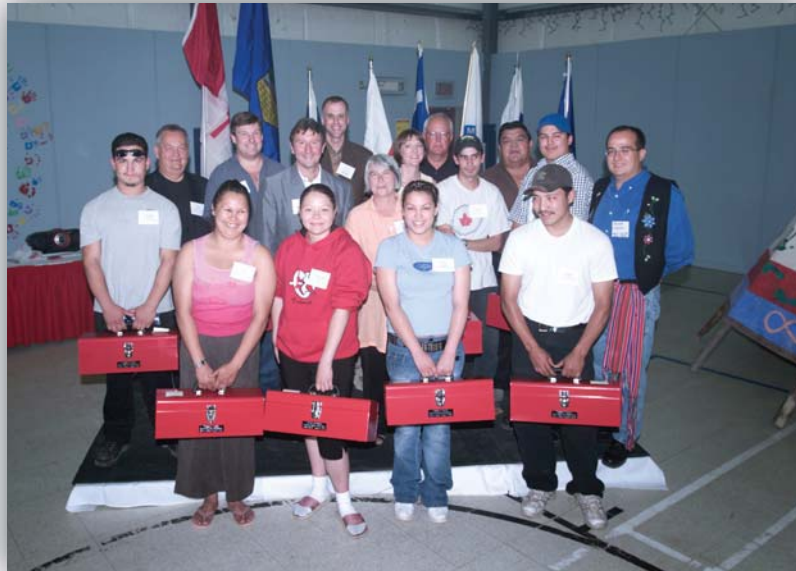
Finissants du programme Trades in Motion , dirigé par l'Institut de technologie du Nord de l'Alberta (Northern Alberta Institute of Technology – NAIT)

Les avoirs pétroliers et gaziers de la société Devon Canada Corporation représentent une production stable et soucieuse de l'environnement ainsi qu'un fondement propice à la croissance future. La société produit environ 202 000 barils de pétrole pur par jour, soit un tiers de sa production globale. La société compte à peu près 1 400 employés dans ses opérations canadiennes.