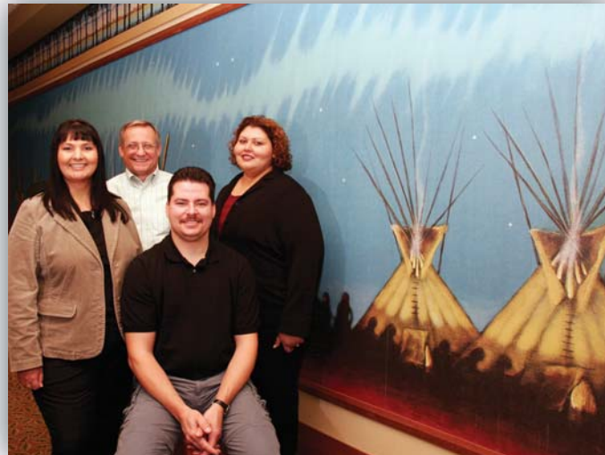
Équipe de sensibilisation aux Autochtones de Syncrude

En plus d'être une source régulière de main-d'oeuvre qualifiée, les collectivités autochtones de la région contribuent leurs connaissances