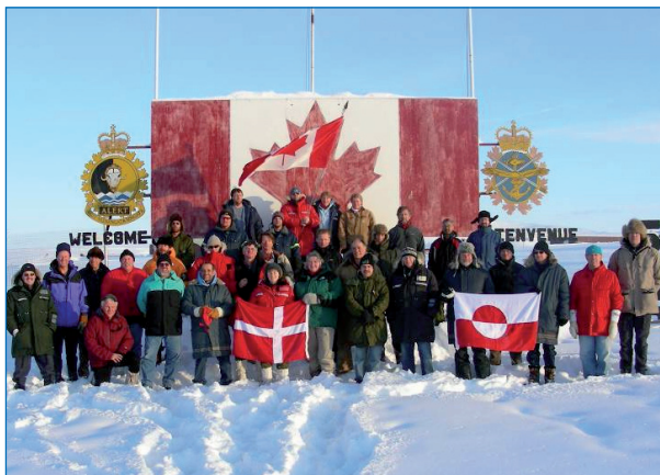
L'équipe de chercheurs du Canada et Danemark durant les travaux sismiques à Alert en 2007.

Le Canada explore également des possibilités de collaboration avec deux autres pays arctiques, la Russie et les États-Unis.