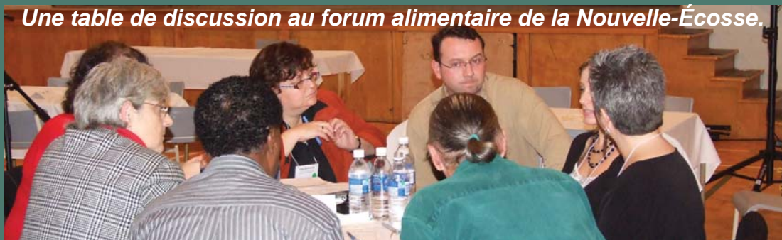
Une table de discussion au forum alimentaire de la Nouvelle-Écosse.

L'Équipe rurale de la Nouvelle-Écosse a organisé avec succès un forum destiné au secteur de l'alimentation de la province. Ce forum avait pour but d'examiner les principaux enjeux et priorités dans le domaine de la production, de la distribution et de l'innocuité des aliments, y compris la disponibilité d'aliments nutritifs et abordables produits localement et l'accès à de tels aliments, ainsi que la recherche, la transformation, la préparation, le transport, la commercialisation, l'achat, la distribution et même l'élimination des aliments que nous consommons. Ce forum a réuni 83 participants parmi lesquels figuraient des agriculteurs, pêcheurs, grossistes, détaillants, nutritionnistes, restaurateurs, travailleurs en santé communautaire, analystes des politiques et chercheurs de la région. Un document de travail a été distribué avant le forum; un rapport final a ensuite été rédigé puis distribué aux participants afin d'être étudié dans le cadre des processus fédéral et provincial d'élaboration des politiques. Les partenaires se sont engagés à faire un suivi sur des questions précises, notamment l'analyse des kilomètres-aliments, le leadership rural, la promotion de la production locale et les marchés des agriculteurs.