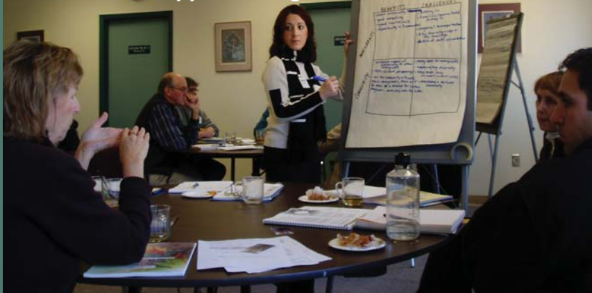
Une activité d'apprentissage à Trail en C.-B.

Toutes les collectivités rurales choisissent le thème de leur journée d'apprentissage en précisant pourquoi ce thème revêt de l'importance pour elles, indiquent quelles ressources et quels intervenants pourraient être mis à contribution pour cette journée et précisent les mesures de suivi qu'elles entendent prendre.