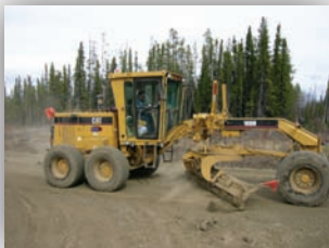
Une niveleuse à l'oeuvre dans le cadre d'un projet d'entretien routier pour la société Husky Energy