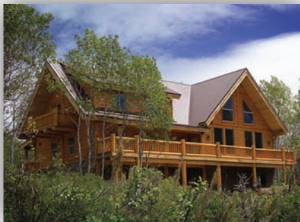
L'une des belles maisons de rondins construites par la compagnie

La compagnie a achevé dernièrement plusieurs projets impressionnants des deux côtés de la frontière canado-américaine.