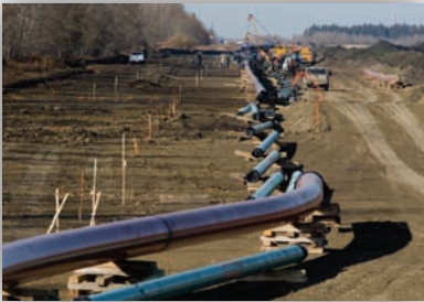
Des travaux de construction de l'oléoduc de Waupisoo en cours au mois d'octobre 2007

Entreprise canadienne qui exerce ses activités à l'échelle mondiale, Enbridge compte plus de 5 700 employés. Fière de sa politique en vigueur depuis sa création, laquelle préconise le maintien de relations respectueuses et l'interaction continue avec les Autochtones au sein de toutes ses opérations, Enbridge est guidée par sa politique en matière de responsabilité sociale ainsi que par sa politique sur les Autochtones. En 2007, Enbridge a reçu un honneur pour la troisième année consécutive pour avoir été au nombre des 100 sociétés les plus durables au monde, telles qu'elles ont été choisies par Global 100. Par ailleurs, on décerne souvent d'autres prix nationaux et internationaux à Enbridge pour souligner son rôle de dirigeant au chapitre de la durabilité, de la saine gouvernance et de la responsabilité des sociétés pour ne nommer que quelques indicateurs. Prendre les bonnes mesures porte fruit!