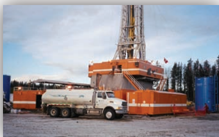
Un camion-citerne à eau situé devant l'appareil de forage Bear N° 5

Cours des dix dernières années, Triple-H Construction a été un pilier de la région adjacente à la réserve de la région Pigeon Lake, située au cœur du champ de pétrole Bonnie Glen. Depuis des décennies, le champ de pétrole Bonnie Glen est l'un des plus importants champs producteurs de pétrole du secteur sud de la province. Parmi ses opérations, mentionnons la construction de concessions et de routes, l'assainissement des lieux, la construction de pipelines et de réseaux d'aqueduc et d'égouts ainsi que d'autres travaux d'infrastructure. Tout cela s'annonce prometteur pour la Première nation de Samson en termes de possibilités de formation préparatoire à l'emploi et de production de richesses comme le dicte le mandat de l'entreprise.