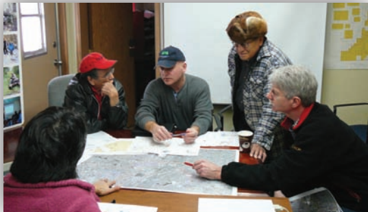
Des consultations entre des employés et des membres de Premières nations au sujet d'une ligne de transmission de 240 kilovolts, prévue pour le secteur nord-ouest de l'Alberta

ATCO Electric poursuit son étroite collaboration avec des collectivités autochtones afin, d'une part, de mieux comprendre leurs cultures et, d'autre part, de favoriser l'équilibre entre leur mode de vie traditionnel et les besoins opérationnels de l'entreprise.