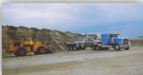
Du gravier en cours de chargement dans la réserve de la tribu des Blood

La diversification continue de ses co-entreprises témoigne de leur succès. Les recettes tirées de ces opérations ne cessent d'être réinvesties dans des projets d'agrandissement pour profiter aux employés et favoriser la croissance économique des collectivités dans lesquelles ils vivent et travaillent.