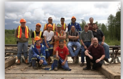
Des membres de l'équipage de la scierie de la Première nation de Heart Lake

documents réglementaires, Enbridge a travaillé de concert avec plusieurs collectivités autochtones afin de compiler et de recenser le savoir traditionnel. Plus précisément, Enbridge a contribué grandement à la construction et au lancement de la scierie de la Première nation de Heart Lake; elle a par la suite passé une commande pour acheter 50 000 bachons destinés à être utilisés dans la construction d'oléoducs. Dans un même ordre d'idées, Enbridge a attribué à de nombreux organismes autochtones et Premières nations un marché collectif totalisant 11 millions de dollars pour le défrichage, le transport de grumes et l'assainissement postérieur aux travaux. Par ailleurs, la compagnie a embauché un spécialiste en perfectionnement des compétences, sans oublier de mentionner qu'elle compte parmi son personnel un agent de liaison avec les Autochtones pour la durée des travaux.