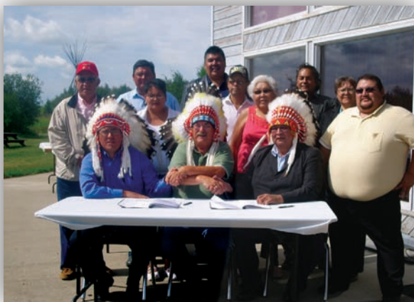
Une cérémonie de signature tenue pour marquer l'établissement d'un partenariat avec la Première nation de Flying Dust

Dans le cadre de son expansion, Samson Oil and Gas poursuit des pourparlers avec un certain nombre de bandes de la Saskatchewan au sujet de la possibilité d'exploiter des terres visées par les droits fonciers issus de traités. En août 2007, la compagnie a conclu une entente avec la Première nation de Flying Dust, établie près de Meadow Lake, en Saskatchewan, en vue d'entreprendre des projets d'exploitation pétrolière et gazière en collaboration avec la Première nation en question.