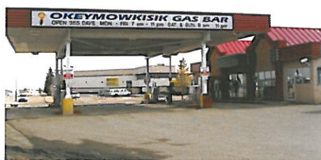
Le poste d'essence et dépanneur Okeymowkisik, l'une des cinq entreprises que possède et exploite la société SML

Cette croissance est attribuable, en grande partie, à l'engagement pris pour assurer la saine gestion et l'établissement d'un conseil d'administration dont les membres font preuve d'un professionnalisme hors pair et sont bien instruits dans les domaines des affaires, du droit, des finances et de la gestion administrative.