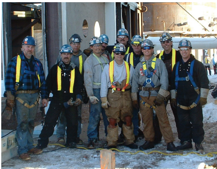
L'une des équipes de travail d'Aqua Industrial