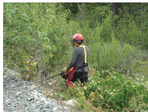
Travaux de débroussaillage en vue de la construction d'une emprise routière près de Grand Cache

L'intégration du savoir traditionnel dans tous les aspects de la prestation des services offerts par l'ADC constitue un atout clé de ses services environnementaux. En effet, les membres du personnel de l'ADC possèdent de précieuses connaissances sur les terres traditionnelles ainsi qu'un savoir scientifique qui se traduit par un produit fini à valeur ajoutée au profit des clients et par des plans de développement et d'atténuation optimaux. De plus, les connaissances et le savoir appliqués par le personnel tiennent compte des valeurs communautaires et de son désir de préserver l'intégrité des écosystèmes, tout en respectant d'autres intérêts en matière de développement.