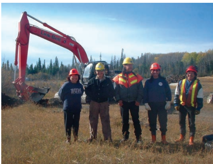
L'une des équipes de travail de la société

La nation Aseniwuche Winewak est un groupe de fiers Indiens non inscrits qui compte quelque 400 membres qui se sont établis à proximité de Grande Cache dans les contreforts des Rocheuses. La Première nation détient en fief simple les terres que la Couronne provinciale lui a transférées au début des années 1970. Cette population s'est vue forcée de déménager à plusieurs reprises et a subi relativement tard la transition vers la vie moderne au