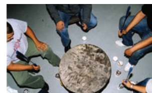
Participants à une danse au tambour

On encourage la participation à titre volontaire des employés à différentes initiatives communautaires, notamment à Habitat chez soi et Centraide. Savanna Energy Services apporte son appui à plusieurs œuvres de charité, aussi bien sous forme de ressources financières que sous forme de ressources humaines et matérielles. À cet effet, la compagnie vise en particulier les hôpitaux en milieu urbain et rural et les organismes qui se consacrent à venir en aide aux enfants, aux personnes les moins favorisées et à ceux atteints d'une maladie grave ou terminale. Par ailleurs, Savanna Energy Services appuie fortement l'idée de promouvoir l'éducation, surtout chez la jeunesse autochtone. En effet, la compagnie parraine des bourses d'études de trois ans d'une valeur de 2 500 $ au profit des étudiants ayant terminé leurs études de première année en technologie du génie pétrolier aux deux établissements suivants : Northern Alberta Institute of Technology (NAIT) and Southern Alberta Institute of Technology (SAIT). L'entreprise a fait dernièrement un don de 10 000 $ (le même montant offert par un autre donateur) pour appuyer différentes initiatives d'élaboration de programmes autochtones à l'Université de Lethbridge. Il n'est pas surprenant d'apprendre que la compagnie figure de nouveau parmi les finalistes du prix Pratiques autochtones exemplaires , dont elle a été récipiendaire en 1995.