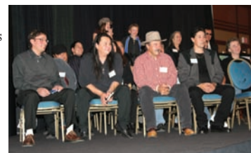
Récipiendaires précédents du premier prix à l'exposition d'art