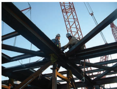
Monteurs de charpentes d'acier à l'oeuvre