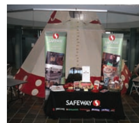
Exposition de Canada Safeway à l'occasion de la Journée nationale des Autochtones

Parmi les nombreux partenaires avec lesquels Canada Safeway travaille dans le cadre de sa stratégie d'embauche et de formation de travailleurs autochtones, mentionnons les suivants : le Programme de développement des collectivités de la région visée par le traité n° 7; Aboriginal Futures – en collaboration avec le ministère du Travail et de l'Immigration (Alberta) – qui offre aux Autochtones vivant en milieu urbain de Calgary l'occasion d'acquérir des compétences professionnelles particulières; l'Oteenow Employment Services, organisme avec lequel Canada Safeway a conclu un protocole d'entente concernant l'embauche et la formation; l'Initiative pour les Autochtones en milieu urbain de Calgary (IAUC); SAIT Chinook Lodge; et l'Aboriginal Youth Employment Centre. La compagnie a pris une part active à une quinzaine de salons de recrutement d'Autochtones au cours des deux dernières années, en plus d'assurer une présence publicitaire régulière dans des publications, telles que SAY Magazine , le Native Journal , ainsi qu'à la banque d'emplois pour Autochtones.