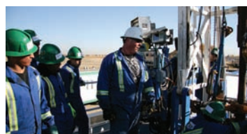
Des apprentis à l'œuvre dans l'un des appareils de forage de Savanna Energy

Savanna Energy Services Corporation s'est forgée une réputation en tant que « compagnie de forage des Autochtones », désignation qu'elle porte avec beaucoup de fierté. Après tout, ses multiples partenariats avec différentes Premières nations font partie intégrante de ses nombreuses opérations. Par ailleurs, la compagnie ne ménage aucun effort pour veiller à ce qu'elle soit digne de cette réputation et de la désignation s'y rattachant.