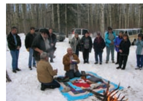
Bénédictio au chantier de Jackfish

Le slogan « Un engagement profond » reflète, bien sûr, les opérations de Devon Canada, notamment en ce qui a trait à ses relations avec les collectivités autochtones. Fort d'un programme détaillé en matière de relations autochtones, la société et son personnel veillent à établir et à entretenir des relations mutuellement avantageuses avec les collectivités qui sont touchées par les opérations