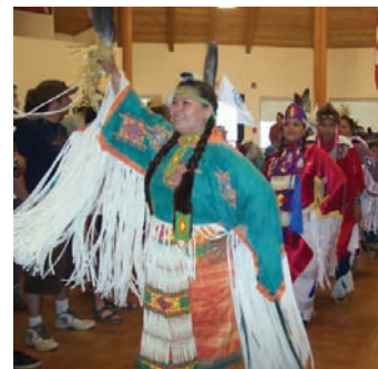
Danseurs au festival de Fort McKay parrainé par ESS Services de soutien