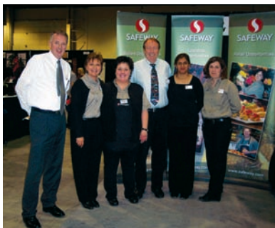
Des employés à une exposition autochtone du salon de l'emploi

« Les Autochtones connaissent le plus fort taux de croissance démographique au pays et représentent donc une tranche importante de la population active future. Nous allons de l'avant pour travailler de concert avec plusieurs organismes dans le but d'exploiter les talents et les habiletés existants et de poursuivre cette initiative à l'avenir. »