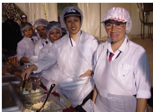
Personnel de cuisine à un camp situé dans le Nord de l'Alberta.