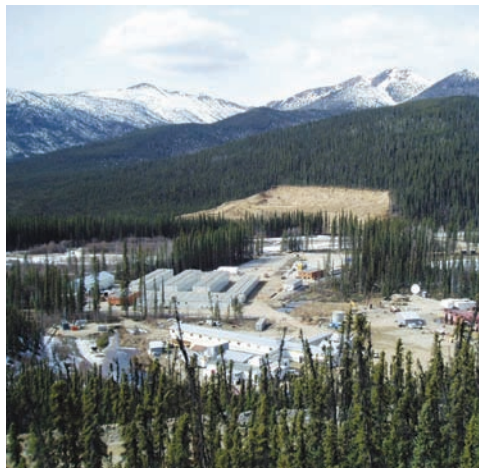
Installation type en région éloignée d'ESS Services de soutien.

Outre le domaine de l'emploi, ESS Services de soutien est un chef de file dans d'autres initiatives visant à appuyer les collectivités autochtones. Encore cette année, ESS Services de soutien figure parmi les neuf entreprises à remporter la Palme d'or (la plus haute désignation possible) pour le programme Relations autochtones progressives, qui relève du Conseil canadien pour le commerce autochtone. De plus, la compagnie est un commanditaire fondateur du Temple de la renommée du commerce autochtone, un important bailleur de fonds pour la Foundation for the Advancement of Aboriginal Youth et le Programme de mentorat autochtone, en plus de jouer un rôle actif dans plusieurs activités culturelles, sportives et sociales dans différentes collectivités réparties un peu partout en Alberta.