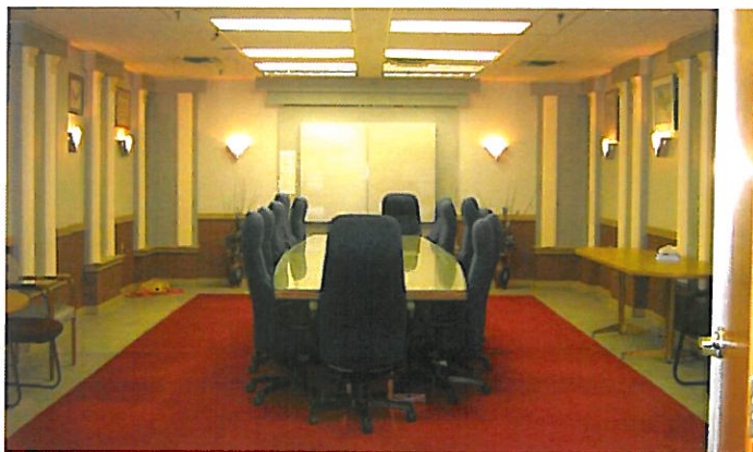
La salle du conseil d'administration située dans le bureau central

Sur le plan des investissements, Samson Management Ltd. a conclu de nombreux partenariats qui ont porté fruit, notamment une entente sur la prestation de services avec la Première nation de Cold Lake, l'achat de parts de Vast Exploration Inc., l'achat de fonds auprès du Groupe Investors et l'acquisition de parts et d'obligations de la société en commandite Crown Properties Inc. Toutes ces activités ont contribué à la rentabilité soutenue de la société, dont le bénéfice net est passé de moins de 200 000 $ à près de 1 million de dollars en cinq ans à peine.