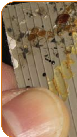
Punaises des lits cachées derrière une moulure de caoutchouc