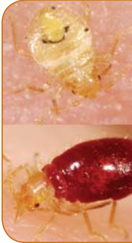
Nymphe de punaise des lits avant et après s'être nourrie