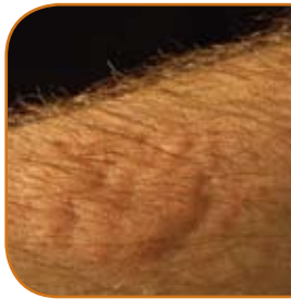
Morsure de punaise des lits