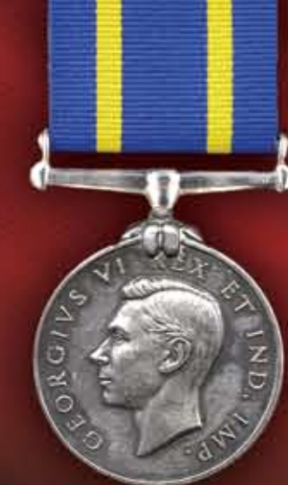
George VI 1937-1948