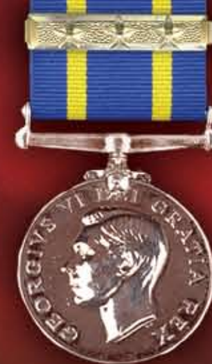
George VI 1949-1953