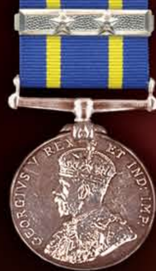
George V 1935-1937

75 années de reconnaissance de service et de bonne conduite