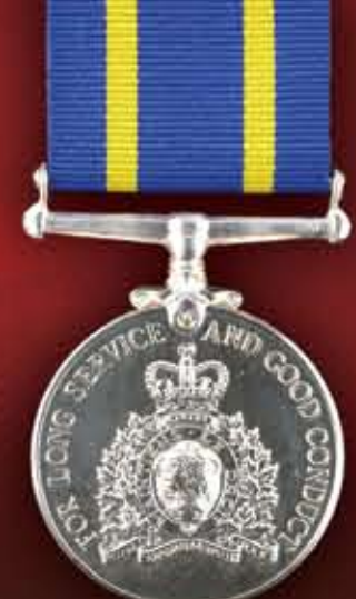
Queen Elizabeth II 1978-present