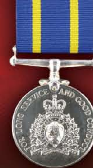
Reine Elizabeth II 1978-présent