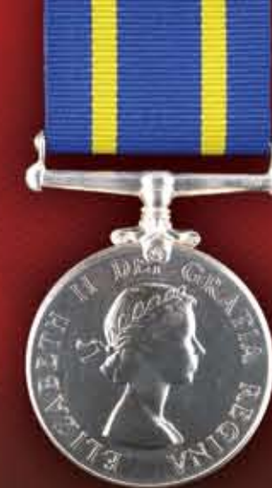
Reine Elizabeth II 1953-présent