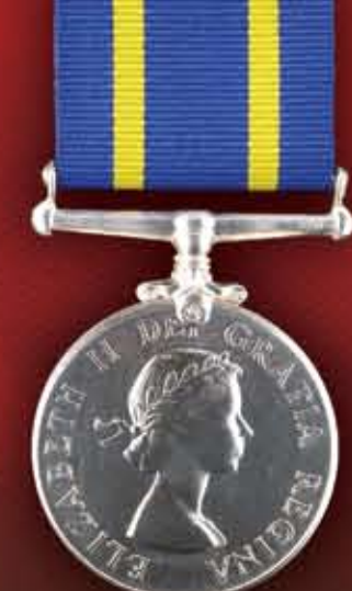
Queen Elizabeth II 1953-present