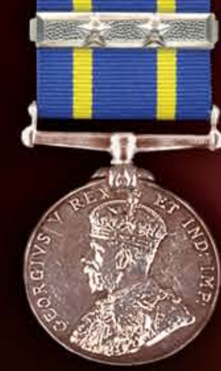
George V 1935-1937