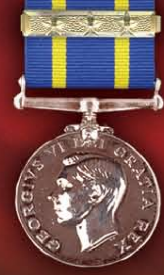
George VI 1949-1953