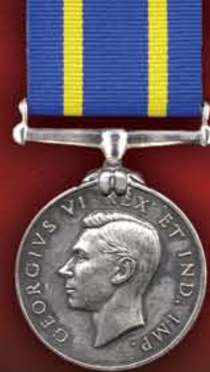
George VI 1937-1948