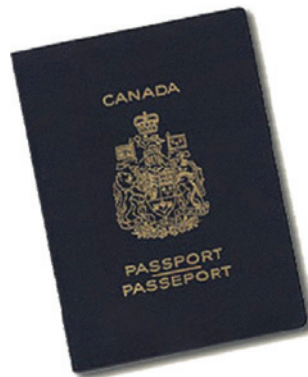
Passeport du Canada (ou d'un autre pays, par exemple les États-Unis)