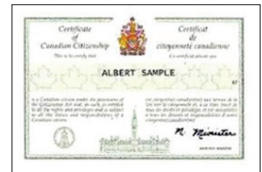
Carte de citoyenneté canadienne