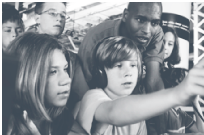
Jeunes visiteurs au Centre des sciences de Montréal

Faire en sorte que les musées apprennent grâce au RCIP et aux autres musées, et que les Canadiens, en particulier les jeunes, s'instruisent grâce aux musées.