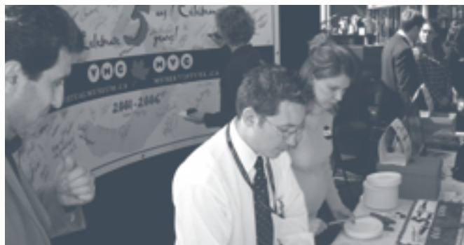
Department of Canadian Heritage employees celebrate the MVC's fifth anniversary.

Les expositions en ligne procurent aux établissements du patrimoine un nouveau forum passionnant pour présenter leurs collections et faire la démonstration de leur créativité.