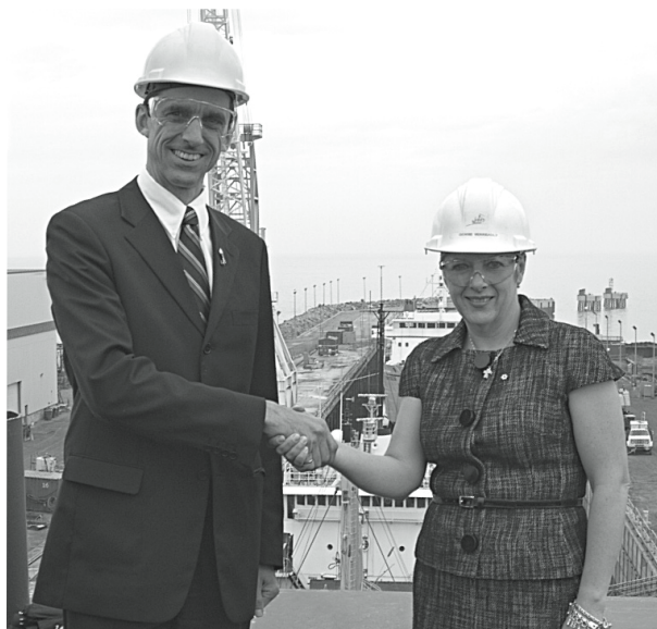
MPO R. TARDIF

Le NGCC Tracy est un baliseur moyen, à faible tirant d'eau, de 55,32 mètres de longueur. Il possède une certaine capacité de brise-glace et peut mettre à l'eau et récupérer une embarcation d'intervention rapide. Il est utilisé principalement pour l'entretien des aides à la navigation, le déglacage et le contrôle des inondations, ainsi que pour les interventions environnementales.