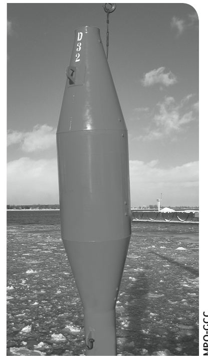
Prototype d'une bouée quatre saisons

En 1962, on assiste à la création de la Garde côtière canadienne (GCC), dont l'un des mandats est de veiller à ce que le trafic maritime se fasse en toute sécurité, tout en fournissant une aide efficace à la navigation. Bien que ce mandat de la Garde côtière canadienne n'ait pas changé depuis ce temps, les technologies utilisées pour assurer la sécurité des navires ont largement évolué.