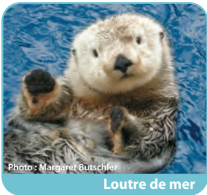
Loutre de mer