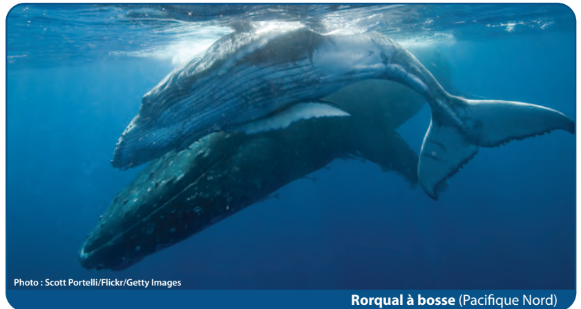
Rorqual à bosse (Pacifique Nord)

Pourrait devenir une espèce en voie de disparition si rien n'est fait pour inverser les facteurs menant à sa disparition du pays ou de la planète.