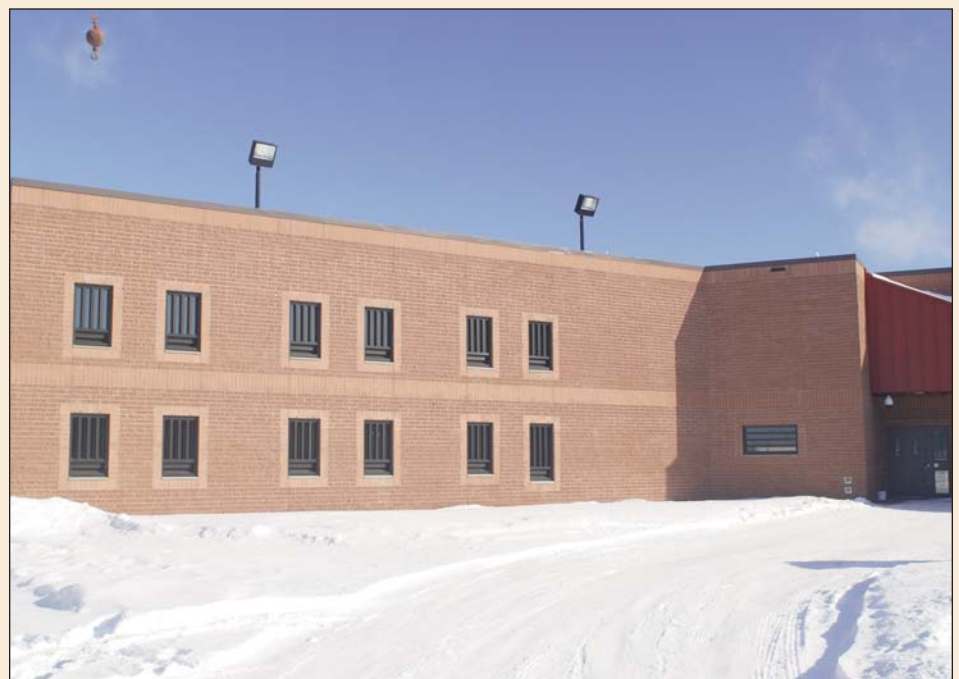
La nouvelle unité à sécurité maximale du Pénitencier de la Saskatchewan à Prince Albert.

Par l'entremise de son secteur des services immobiliers, TPSGC fournit aux ministères et organismes fédéraux une gamme de services immobiliers, allant des stratégies d'investissement initial et de la construction à la location d'installations et l'entretien, la réparation et l'aliénation des biens immobiliers.