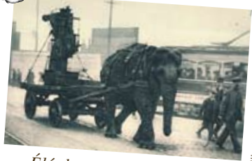
Éléphant de la Première Guerre mondiale.

Mon ancêtre Bandoola a servi pendant la Seconde Guerre mondiale en Birmanie, en Asie. Lui et d'autres éléphants déplaçaient des billots pour construire des ponts. Ils transportaient aussi des gens pour traverser les rivières et tiraient des camions militaires pris dans la boue. Je me souviendrai toujours de Bandoola!