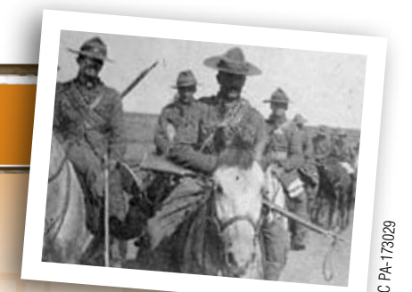
Second Bataillon de fusiliers canadiens en patrouille en Afrique du Sud en 1902.

Imagine à quel point les chevaux devaient être courageux