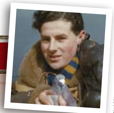
Pigeon voyageur de la Royal Air Force, 1942.

tirait en sa direction car il savait qu'il transportait un message important. Mais nous, les pigeons, sommes super rapides. Nous pouvons voler jusqu'à 100 kilomètres à l'heure, et c'est pour cela que les nouvelles arrivaient généralement à bon port! Certains oiseaux livraient leur message même après avoir été blessés.