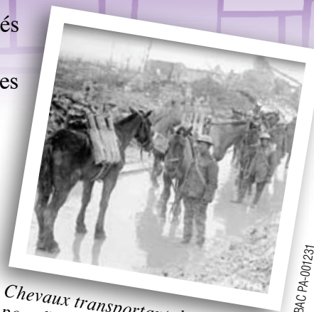
Chevaux transportant des munitions pour l'artillerie de campagne canadienne. Avril 1917.

Des éléphants, forts et futés comme moi, transportaient du matériel et aidaient à construire des routes et des campements dans les jungles de la Birmanie durant la Seconde Guerre mondiale. Les braves bêtes ont toujours fait leur part!