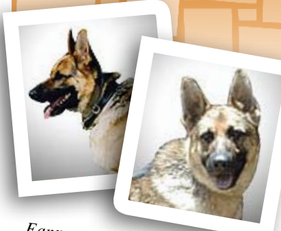
Fanny et Alex, chiens détecteurs de mines.

La Fondation des mines terrestres du Canada