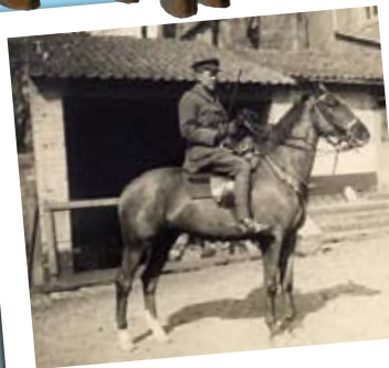
John McCrae et Bonfire.

Durant la Première Guerre mondiale, mon ancêtre Bonfire était le meilleur ami d'un médecin et poète canadien nommé John McCrae. Bonfire transportait le médecin jusqu'au champ de bataille. Tristement, le D r McCrae est décédé en 1918. Bonfire a fièrement participé au cortège funèbre militaire du D r McCrae.