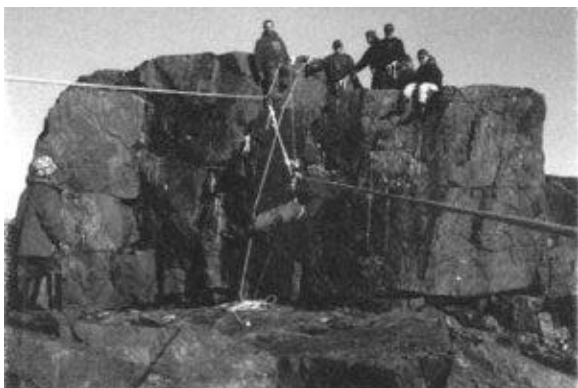
Entraînement des Rangers juniors inuits au camp d'instruction Nanooapik au nord de Puvirnituq, en août 1997.

Les Rangers canadiens sont des membres volontaires âgés de 18 à 60 ans; ils reçoivent un entraînement de base leur permettant d'assurer au besoin le soutien des membres des Forces canadiennes dans les régions côtières, éloignées et nordiques. Les Rangers juniors sont formés de jeunes garçons et filles de 12 à 17 ans provenant des collectivités du Nord qui possèdent déjà des patrouilles de Rangers. Les cadets, pour leur part, ont entre 12 et 18 ans et sont regroupés à l'intérieur d'une organisation civile parrainée par les Ligues des cadets.