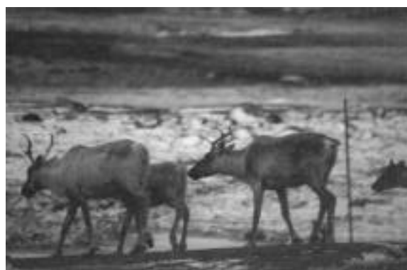
Troupeau de caribous de la Rivière aux Feuilles à Inukjuak. La commercialisation de la viande de caribou est un autre exemple d'activités prometteuses pour le développement économique du Nunavik.

En 1997, il n'y a pas eu d'abattage commercial de caribou sous inspection fédérale. Toutefois, deux sociétés représentant les Autochtones du Nunavik ont manifesté de l'intérêt pour entreprendre l'abattage commercial au début de l'année 1998. L'abattage s'effectuera à l'extérieur sous la tente et les inspecteurs et les vétérinaires superviseront les opérations.