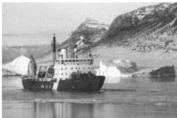
Le NGCC DES GROSEILLIERS, lors d'une mission de ravitaillement dans la Haute Arctique, mouillé dans le fjord d'Iberville au nord du 80° parallèle.

La Garde côtière continue d'administrer plusieurs programmes ainsi que d'assurer la prestation de nombreux services tels que la protection du droit public de navigation, le déglacage, le maintien d'aides à la navigation, les télécommunications, l'escorte des navires, la recherche et le sauvetage, l'évacuation médicale et le ravitaillement dans l'Arctique.