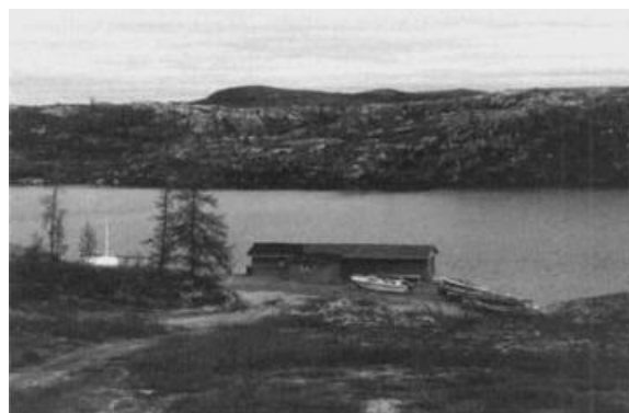
Vue d'une povunguq en territoire naskapie.

Il revient enfin au MAINC de mettre en œuvre les conventions relativement aux obligations du gouvernement canadien. À ce titre, il doit assurer la coordination des différentes interventions des autres ministères et organismes fédéraux qui sont en relation avec les collectivités autochtones.