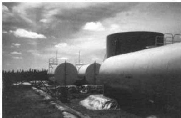
Installation de réservoirs visant à augmenter la capacité de stockage en carburant de la centrale électrique à Waskaganish, en 1997.