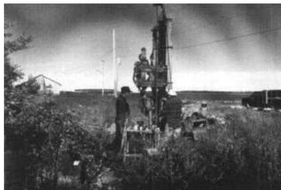
Forage lors de la caractérisation environnementale d'un site à Eastmain, en 1997.

Au cours de l'année financière 1996-1997, le MAINC a versé à l'Administration régionale crie une somme de 452 917 dollars afin de poursuivre les travaux entrepris au titre du Répertoire des préoccupations environnementales dans les collectivités cries. Des analyses de risque pour la santé et l'environnement ont été réalisées sur les sites où une contamination avait été détectée l'an dernier. Des suivis de la qualité de l'eau souterraine ont été effectués aux sites d'élimination des déchets et aux sites contaminés possédant des puits d'observation. Des réservoirs de stockage des huiles usées ont été installés à Waskaganish et à Waswanipi.