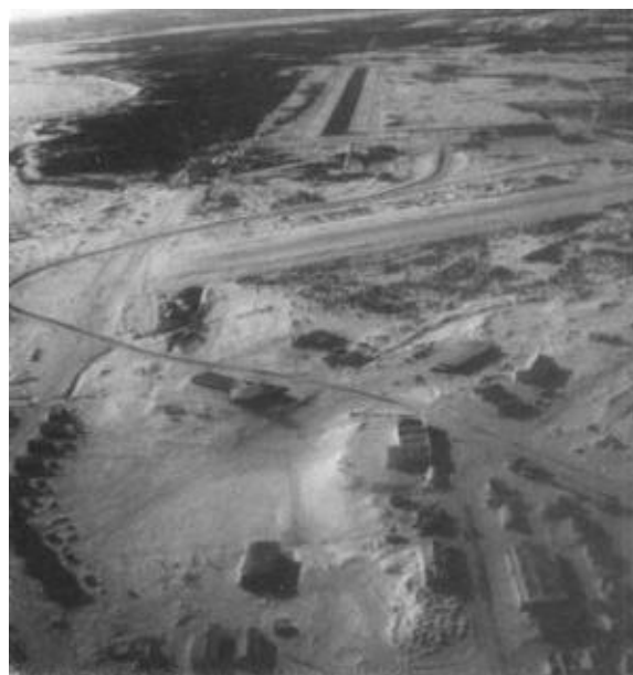
L'aéroport de Kuujuaq a accueilli 33 845 passagers et 7 148 mouvements d'aéronefs en 1996.

En vertu de l'entente de contribution intervenue en 1996, en vigueur du 1 er septembre 1996 au 31 décembre 1999, relative au transfert de la gestion de l'aéroport de Kuujuaq, Transports Canada a versé une somme de 808 000 dollars à l'Administration régionale Kativik au cours de l'année financière 1996-1997. Une étude de caractérisation des sols et de l'eau souterraine le long d'un ancien pipeline qui alimentait l'aéroport de Kuujuaq a aussi été réalisée en 1997.