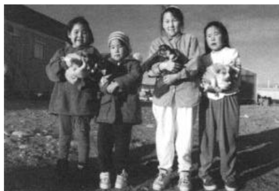
La «relève» à Inukjuak. L'inuktituk est la principale langue en usage dans les émissions de radio et de télévision produites au Nunavik, en plus de faire partie du programme d'études.

Patrimoine canadien, par le biais de sa Direction de la participation des citoyens, appuie un large éventail d'activités dans le Nord du Québec. L'ex-ploitation de réseaux de communication autochtones, le fonctionnement de centres d'amitié, la sauvegarde des langues et des cultures autochtones, le soutien aux organismes et l'amélioration de la situation des femmes autochtones constituent ses principaux champs d'intervention. Au cours de l'année financière 1996-1997, les collectivités autochtones du Nord ont bénéficié, par l'entremise des programmes du ministère du Patrimoine canadien, de 1 842 141 dollars.