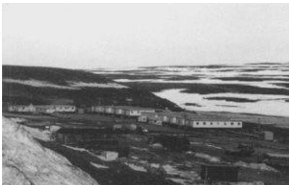
Camps des travailleurs de la mine Raglan à Kattinip, au sud-ouest de Kangiqsujuaq.

Le 29 mars 1996, le gouvernement fédéral mettait sur pied une nouvelle politique intitulée Stratégie d'approvisionnement auprès des entreprises autochtones (SAEA) qui vise l'achat de biens et de services auprès de fournisseurs autochtones. Cette initiative fédérale a été conçue pour accroître la participation des entreprises autochtones au processus d'approvisionnement gouvernemental. La SAEA prévoit des mesures obligatoires et, depuis le 1 er janvier 1997, des mesures sélectives de commandes réservées, des activités de promotion des fournisseurs et l'octroi d'une plus grande part des marchés aux entreprises par chacun des ministères et organismes fédéraux.