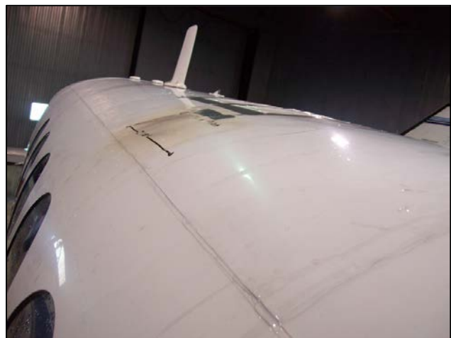
Photo 1. Dommages vus de l'extérieur

Deux panneaux de revêtement intérieur ont subi des dommages par le feu. Le panneau identifié LH/5 se trouve juste à l'avant de la