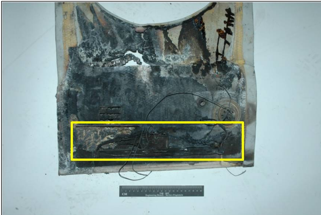
Photo 4. Panneau LH/4 indiquant le lieu du bloc d'alimentation fondu et brûlé

Le bloc d'alimentation électrique de la lumière fluorescente du panneau LH/4 était largement brûlé et fondu. En raison de sa forme, sa taille et son type de connexion, on a établi une similarité avec le bloc d'alimentation électrique du panneau LH/5. Toutefois, aucun étiquetage permettant de l'identifier formellement n'a été retrouvé. Le connecteur de fils en plastique était fondu, mais il était toujours attaché au connecteur du bloc d'alimentation électrique de la lumière fluorescente. Le bloc d'alimentation électrique a été enlevé de son support et les fils ont été coupés afin d'être examinés. Les contacts numéro 1 et 2 étaient manquants, seule la fibre de verre de la carte du circuit imprimé est demeurée relativement intacte alors que le reste avait brûlé. Le métal constituant le contact numéro 1 du connecteur avait fondu en boule, correspondant à un dommage causé par un arc électrique.