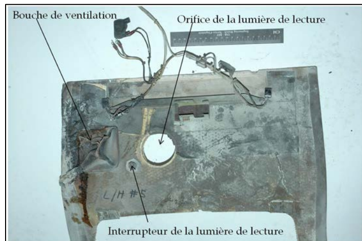
Photo 3. Intérieur du panneau LH/5