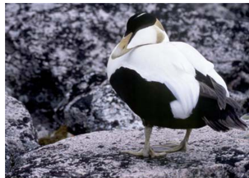
Espèce : Somateria mollissima Eider à duvet

Les Eiders à duvet sont des oiseaux très robustes que l'on peut observer le long des côtes de toutes les nations arctiques. Pendant l'hiver, ils migrent non loin de leurs aires de reproduction, mais certains individus du Canada se rendent au Groenland, où ils peuvent entrer en contact avec des colonies d'oiseaux provenant du Groenland.