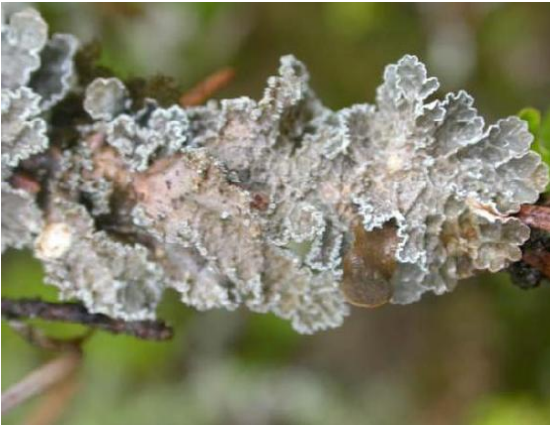
Figure 1. Thalles de néphrome cryptique.

Le néphrome cryptique est un lichen foliacé à lobes larges et non uniformément appressé (aplatis), dont les thalles (parties principales du lichen) mesurent de 2 à 7 cm de largeur. Ses lobes à bordures arrondies ont de 4 à 12 mm de largeur (Brodo et al. , 2001). La face supérieure est mate, de couleur gris jaunâtre pâle à verdâtre ou gris bleu et couverte d'une série d'arêtes inégales et peu prononcées. La face inférieure est également mate, mais légèrement ridée et lisse, et sa couleur varie de brun roux pâle à jaune crème à proximité des bordures à une couleur brun foncé vers le centre. Des sorédiés grossières et granulaires (structures poudreuses de la reproduction asexuelle) sont présentes le long des bordures des lobes et se développent avec l'âge aussi le long des arêtes de la face supérieure des thalles. Le photobionte (partenaire photosynthétique du champignon d'un lichen) du Nephroma occultum est une cyanobactérie. La face supérieure à arêtes en forme de filet, les lobes et les arêtes sorédiés, de couleur gris jaunâtre pâle à gris bleu, ainsi que la face inférieure lisse aident à identifier l'espèce sur le terrain. La figure 1 et la photographie de la page couverture montrent des thalles de néphrome cryptique.