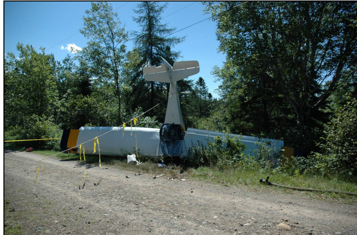
Photo 2. Orientation de l'avion après l'impact

L'orientation de l'avion après l'impact (voir la photo 2) et les dommages à la cellule correspondaient à un piqué prononcé sur le dos typique d'un décrochage aérodynamique à basse altitude suivi d'une vrille 2 . L'avion en question n'était pas équipé d'un avertisseur de décrochage, lequel n'est pas obligatoire dans un aéronef de cette catégorie.