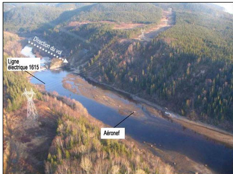
Photo 2. Vue aérienne du lieu de l'accident.

La ligne électrique 1615 traverse la rivière Franquelin (voir photo 2). Les fils qui passent au-dessus de la rivière ne sont pas balisés, et aucune réglementation ne le prescrit. Les pylônes qui soutiennent les fils s'élèvent à 107 et à 77 pieds agl, et ils sont situés de part et d'autre de la rivière. À leur point le plus bas, les câbles de mise à terre supérieurs se trouvent à 283 pieds au-dessus de la rivière, à marée basse.