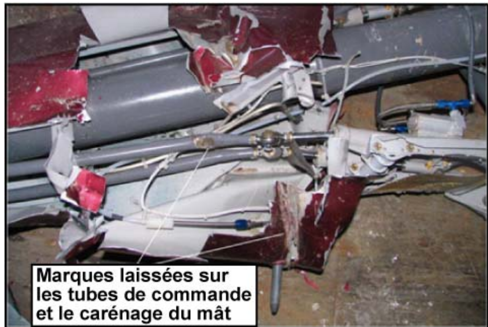
Photo 1. Marques laissées par le câble sur les tubes de commande.

L'hélicoptère a été lourdement endommagé lorsqu'il s'est écrasé sur le banc de sable. Il a heurté le sol alors qu'il se trouvait légèrement en piqué et incliné vers la droite. Les patins d'atterrissage ont été lourdement endommagés, et ils se sont rompus en raison de la surcharge causée par les forces d'impact au moment de la collision avec le sol. Le câble de l'antenne de la radiobalise de repérage d'urgence (ELT) a été coupé.